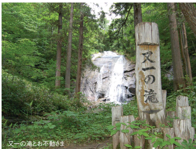
又一の滝とお不動さま