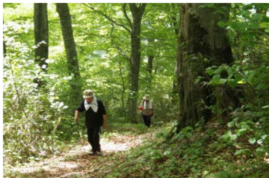
新緑のブナ林を進む登山者