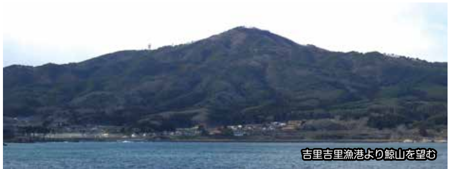
吉里吉里漁港より鯨山を望む