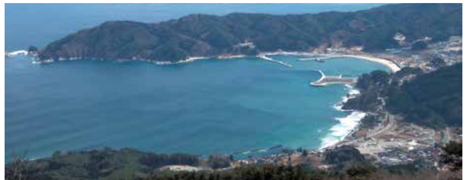
鯨山より浪板海岸を望む