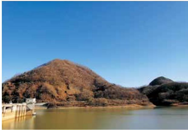
南川ダムからの鎌倉山 (左) と蜂倉山 (右)

この七ツ森の各山頂には、薬師如来が祀られており、一日で全てをお参りする と無病息災が叶うと伝わる「七薬師掛」 が受け継がれており、最高峰の笹倉山で も506mと低いため誰でも登り易い山と なっております。