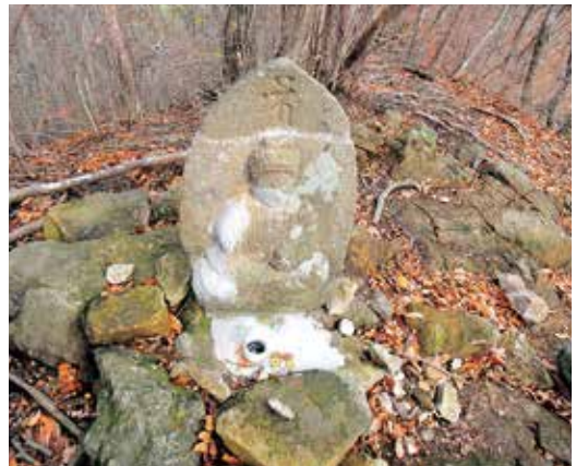
大倉山の薬師如来石像

また、森林事務所管内には宮城県と山 形県の県境にそびえる船形山(標高1、 500m)があります。ブナの原生林が 広がり四季折々に様々な風景を見せてく れます。船形山へは、登山道入口まで車 で通行でき、そこから最短ルートで2時 間程度で登れるため、県内外から自然を 楽しむ多くの方が訪れています。 さて、私が森林官になってから2年が 経とうとしています。先ほど紹介したよ うに、管内には魅力ある山々が沢山あり ますが、この2年間で多くの観光客や登 山者と話しをする機会がありました。林 道での運転に慣れている方やそうでない 方、気軽に自然を楽しめる事から林道を 初めて運転する方もおりました。そのた め林道や国有林というものを理解されて いない方もおり、林道の設置目的や国有 林の事業について理解して頂くのに苦労 しました。これからは、観光客や登山者