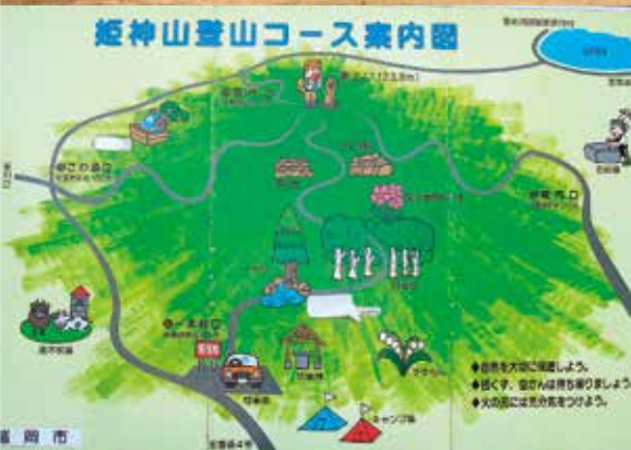
姫神山登山コース