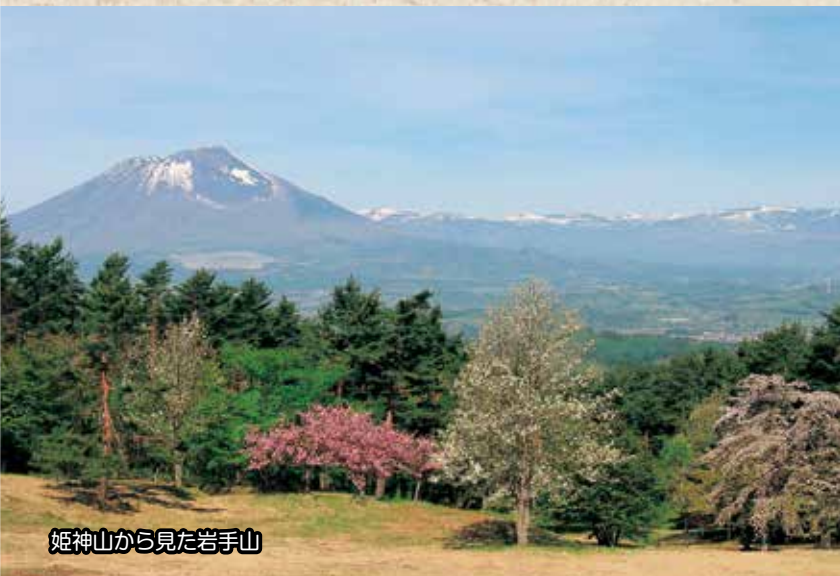
姫神山から見た岩手山