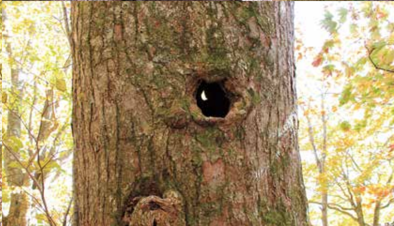
シナノキ大樹の樹洞