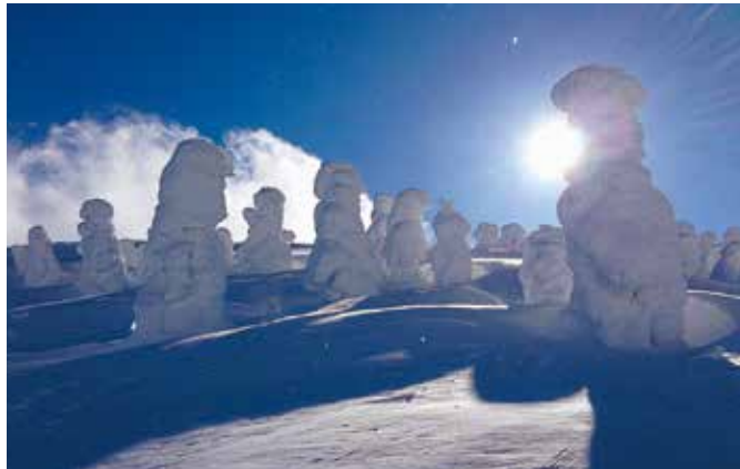
山形県山形市：蔵王スキー場の樹氷

体験プログラムの作成や観光ガイドの育成などと連携することとしています。 現時点の検討案では、現在のレク森毎の整備に加え、複数のレク森を含む広域のエリア（複数の市町村を跨ぐ場合も想定）での魅力的なコース整備等を念頭に、地方自治体等へ事業概要の説明を行い、本年12月頃までに候補地（案）の選定を行い、地方自治体等と連携し、各地域毎の自然・文化・気候・食などと四季が織りなす森林の魅力を地域の皆さんや訪日外国人の方々へ発信して、自然とのふれあいを満喫していただけるよう取り組んで参ります。