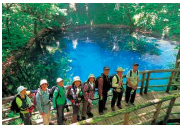
青森県深浦町：白神山十二湖の青池

興等で地域との連携を目的としています。 この取組は、政府の観光ビジョンの目標として、2020年の東京五輪・パラリンピックの開催に向け、訪日外国人旅行者数等の拡大などが検討されており、国有林においてもレク森の優れた自然景観や森林散策等を楽しんでいただける魅力的なコースを整備し、地域の観光や振興等へ活かしていただく取組です。 具体的な取組としては、修景伐採（景観スポットの整備）、散策コースの整備、パンフレット（多言語含む）の作成、看板の整備（多言語含む）などで、市町村等で実施するの森林