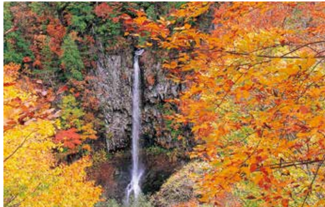
宮城県大和町：色麻大滝