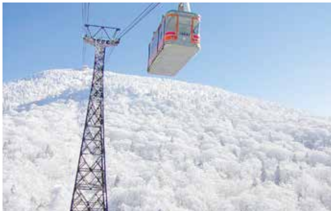
青森県青森市：八甲田スキー場