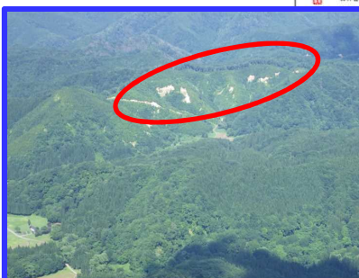
⑨ 由利本荘市(民有林)