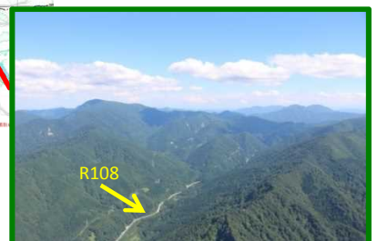
⑪ R108 宮城県境(国有林)