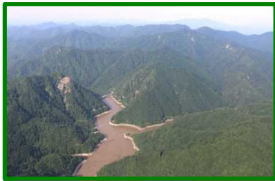
① 萩形ダム上流(国有林)