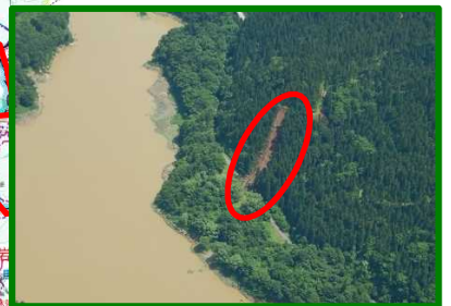
⑤ 岩見ダム上流(国有林)