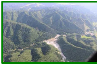
② 大館市田代地区(国有林)