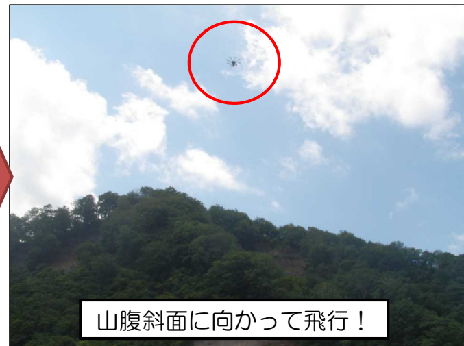
山腹斜面に向かって飛行！