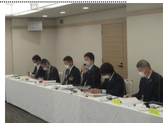
四国森林管理局の説明