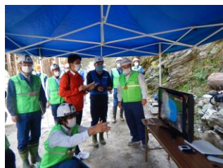
ドローン画像を現場で共有