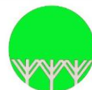
国民の森林・国有林

四国森林管理局 徳島森林管理署 TEL:088-637-1230/FAX:088-666-1818 〒771-0117 徳島県徳島市川内町鶴島239-1