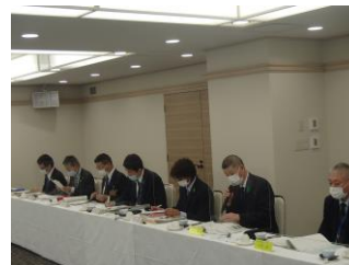
徳島森林管理署の説明