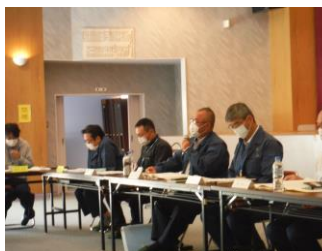
意見・要望等に対する説明の様子