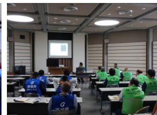
午後からの担当者研修の様子