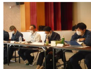
意見・要望等に対する説明の様子