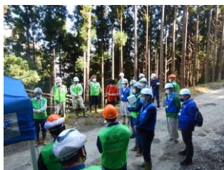
徳島県担当者による開会の挨拶

今後も山地災害が多発する中、状況を迅速かつ的確に把握するため、関係機関との連携を強化し、技術の伝承・人材育成に向け、取組を進めてまいります。