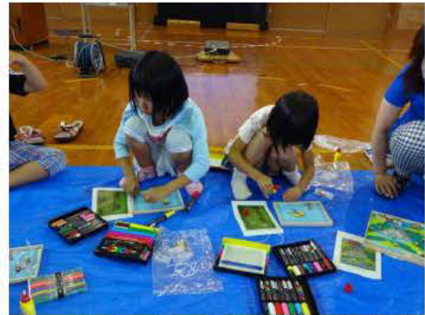
低学年はお手本を見て

大半の子どもたちは鋸をあまり使用した事がないらしく最初は緊張していましたが、鋸を引く時の力加減などを教えるとすぐに覚え、次々と太さが違う小枝を一定の幅に切り揃えていました。