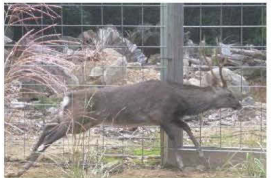
檻の中を駆け回るシカ