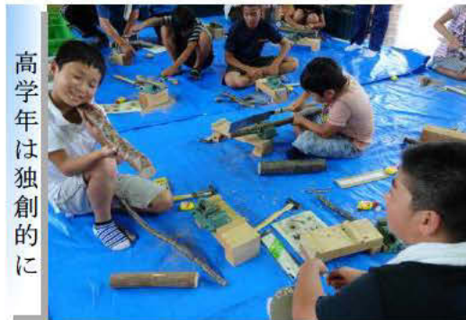
高学年は独創的に

4～6年生は、各自の想像力を活かし、鋸やナイフを使って小枝等を加工し、世界で1つだけの作品を制作しました。