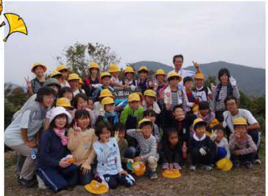
私は愛媛県側？高知県側？

同校は、平成23、24年度、愛媛県教育委員会の「森はともだち推進事業」の指定校として森林環境学習に力を注ぎましたが、事業終了後も森林環境学習を続けています。昨年度は全校児童で滑床溪谷を散策、今年度は三本杭に登りました。