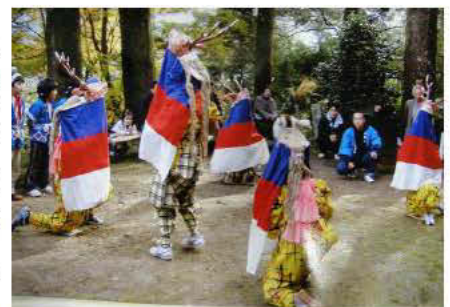
「五鹿踊り」奉納の様子

また、幡多十景に登録されている金毘羅山にある金毘羅宮では、春と秋にお祭りが開催され、伝統芸能「五鹿踊り」が奉納されます。この「五鹿踊り」は、江戸時代、愛媛県南予にある宇和島藩の初代藩主伊達秀宗が仙台から入城した際にもたらされ、西ヶ方の「五鹿踊り」は愛媛県南予地方との交流の中で伝わったとされています。