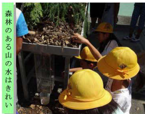
森林のある山の水はきれい

最初に森林の大切な働きである「水を蓄える働き」と「山崩れを防ぐ働き」等について説明し、その後「森林のある山」と「森林のない山」の治山模型を作り、ジョウロで雨を降らせて森林の働きを実証しました。