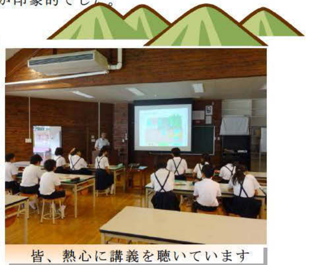
皆、熱心に講義を聴いています

まず、「森林の大切な働き」についてパワーポイントを使って講義し、森林の持つ「水を蓄える」、「山崩れを防ぐ」、「快適な環境を作る」、「地球の環境を守る」など7つの働きを学習してもらいました。また、普段からこの働きを気にかけてもらおうと、技術普及課作成の下敷「森林の大切な働き」も児童に配布しました。