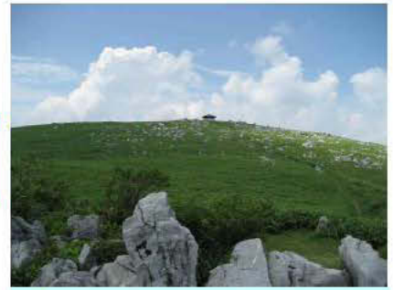
四国カルスト(日本三大カルスト)