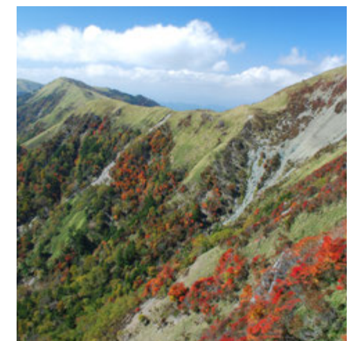
三嶺付近の紅葉。標高の高い箇所にはダケカンバやナナカマドなどが生育しており、秋には見事な紅葉が見られます。山頂付近は10月中旬ごろから紅葉が始まります。