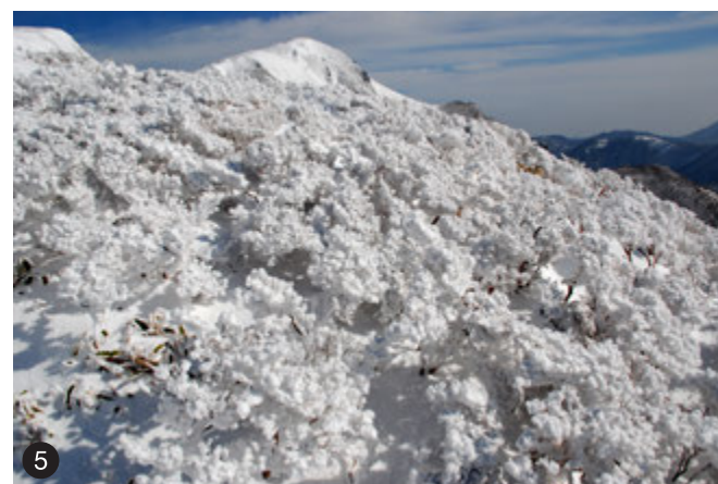
❶ 保護林の全景。三嶺から登山口のあるヒカリ石の近くまで、四国最大規模の原生林を見ることができます。❷ ハクサンハタザオ(5月)。花が咲いた後に茎が倒れて新しい苗を出すことがあります。❸ チャボツメレンゲ(10月)。岩場に生育し、葉が肉厚です。❹ タカネオトギリ(7月)。稜線付近でよく見かける夏の花です。❺ 樹氷に覆われたコメツツジ(1月)。写真奥に見える三嶺山頂から天狗塚までの稜線には、コメツツジとミヤマクマザサ群落があり、国の天然記念物に指定されています。