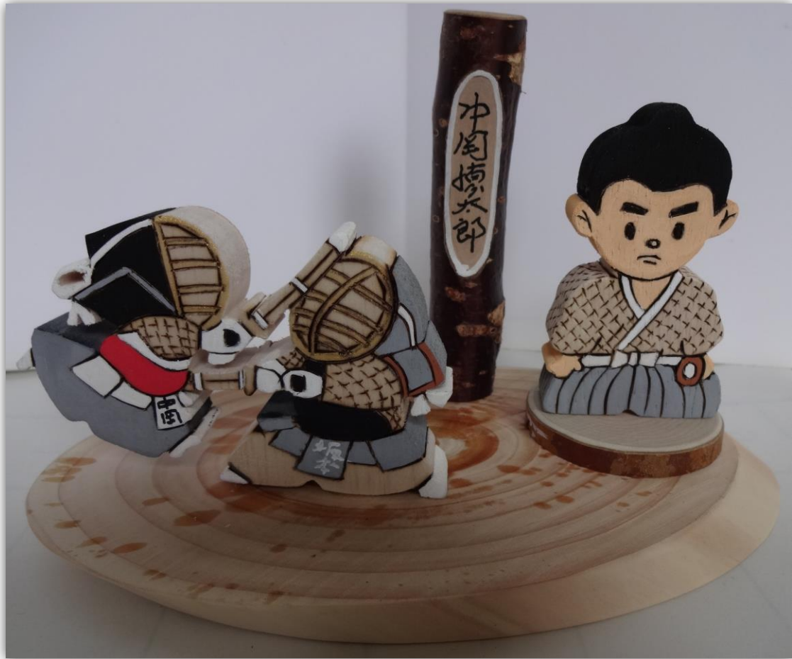
面一本 龍馬よ まいったか