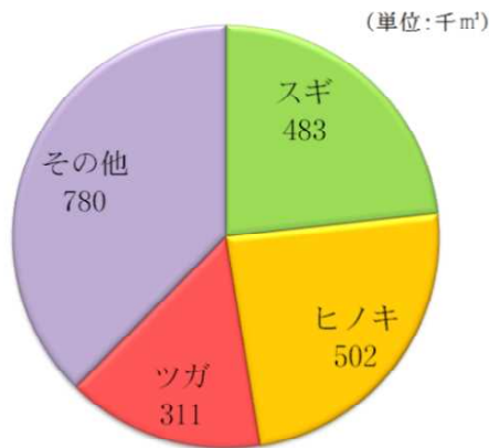
主要な樹種の賦存状況