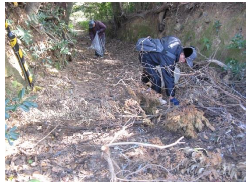
山の散策道の修繕、清掃活動等の様子