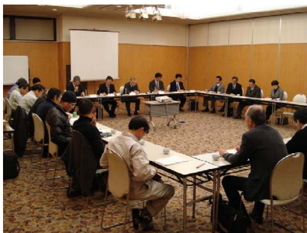
国有林野の森林計画に関する地区懇談会 (香川県高松市)

平成22年度においては、吉野川、南予、四万十川の各森林計画区に該当する自治体や団体、地域住民等を対象として実施します。