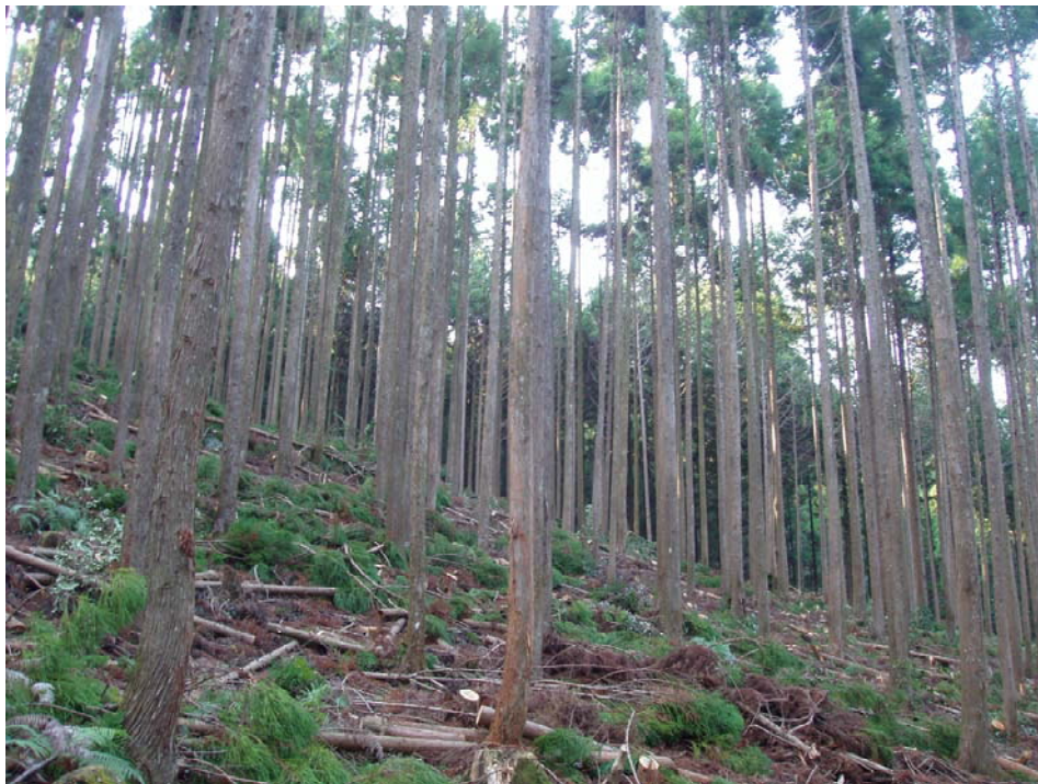
間伐により整備された森林

今後についても、多様で健全な森林の整備と保全の推進を図ることとして、個々の森林の状況、これまでの施業履歴をチェックしながら効率的な森林整備を行い、着実な森林吸収量の確保に努めます。