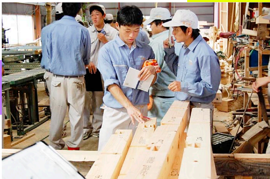
プレカット製材所において