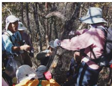
防護ネット巻作業の様子

の群生地で、NPO法人剣山クラブと防護ネットを巻きました。オオヤマレンゲ(モクレン科)は、梅雨の深山に芳香のある白い花を咲かせ、古くから茶花として珍重されてきました。四年前に同NPO法人によって約二〇〇本の自生地が確認され、四国最大級の群生地とも言われています。六月に行った調査に比べて食害による枯死木が三割以上増加しており、これ以上被害が拡大しないように願いながら、ボランティア約三〇名の手で一本一本の木に防護ネットを巻きました。現地までは往復約五時間、急斜面での作業と険しい道のりでしたが、朱色や黄色に色づいた木々は錦絵のようで、真っ青な秋晴れの空とのコントラストは、疲れも忘れさせるすがすがしい一日となりました。三嶺付近ではこのオオヤマレ