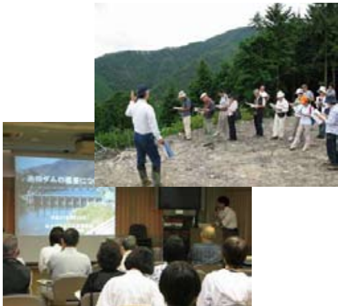
平成21年度第1回勉強会 (徳島県三好市、香川県まんのう町)

林野庁四国森林管理局では、もっと国有林について知りたいという国民の皆様にも、国有林の役割や業務についてご理解いただき、国有林の管理・経営に皆様の声を役立てていく一環といたしまして、「国有林モニター」を募集いたします。