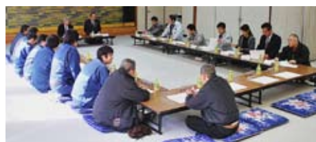
治山事業協議会の様子

当署から、事業の進捗状況、有識者委員会での検討結果や事業の必要性、用地確保への協力