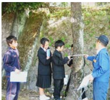
胸高直径を測定中

だけでなく、川や海とのつながりもわかってよかった」「計算が難しかったが一人あたり三七本の木が必要というのは具体的でわかりやすかった」などと書かれていて、山(森林)への関心に繋がりが、次回、一二月の間伐・植樹体験を実施してなお一層関心・興味を持ってもらえるでしょう。