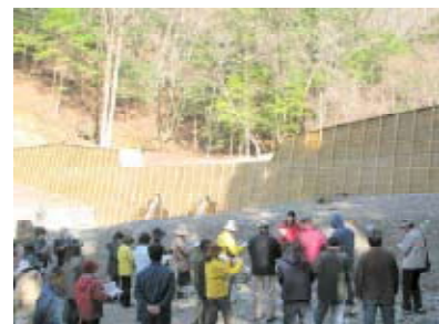
平成21年度第2回勉強会 (高知県いの町、大豊町)