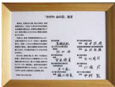
かがわの山の日宣言

地球温暖化、異常気象等如実に周囲の環境は変化しています。が、今回参加した小学生を始めとする時代を担う世代にも「みどり」の大切さを認識すると共に「大事に扱う」という想いが芽生えたものと感じました。