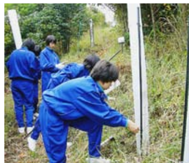
ツリープロテクター取付 (西土佐中学校)

これらの体験は、森林学習の一環として、四万十川の支流、黒尊川源流域の森林の役割を学び、より良い森林に育てたいとの支援要請を受けて実施したものです。 はじめに、職員がシカ食害の現状や森林再生活動を説明した後、植え方の指導をして作業を始めました。生徒らは、植え穴を掘る時は少し苦労していましたが、どの苗木も丁寧に植えられ、シカ食害防護用の「ツリープロテクター」も取り付けました。 後日、下田小学校児童が、体験記として「植樹を体験して、動物や環境のことをもっと考えなければいけないと思った。次に行った時は、もっと緑の多い山になってほしい」と新聞に投稿するなど、森林再生の大切さを理解してもらったことができたようです。