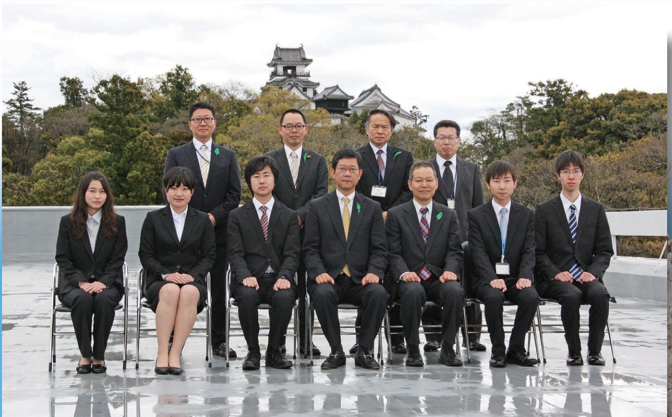
高知城をバックに記念撮影