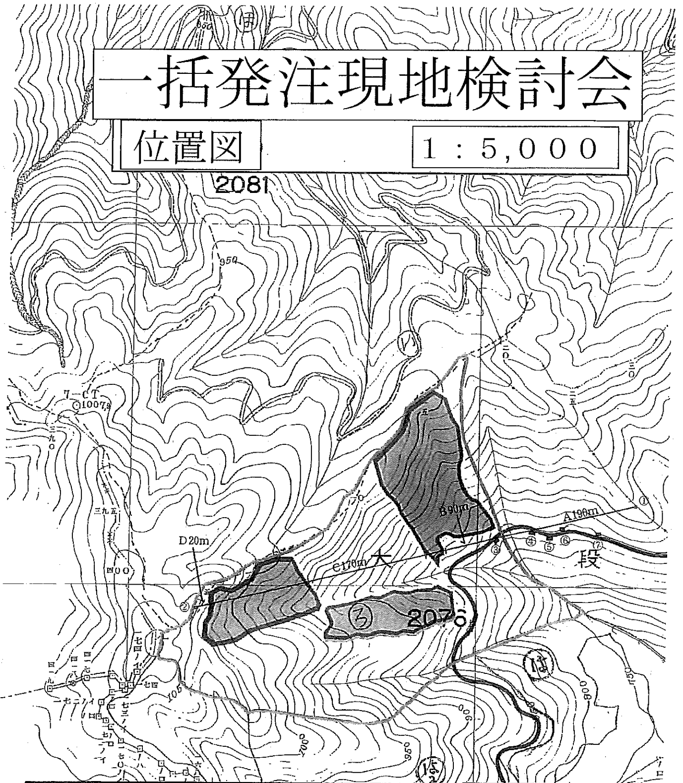
記番別内訳表 (単位:ha・m)