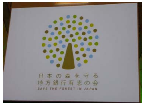
日本に森を守る地方銀行有志の会シンボルマーク

最後に共同宣言や、参加した64行を64枚の葉に見立てたシンボルマークが発表されました。