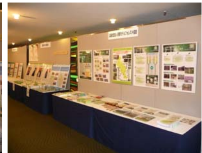
サミットの主催者である (社)京都モデルフォレスト協会のブース