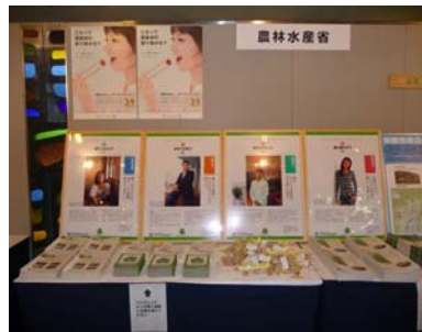
農林水産省の展示ブース