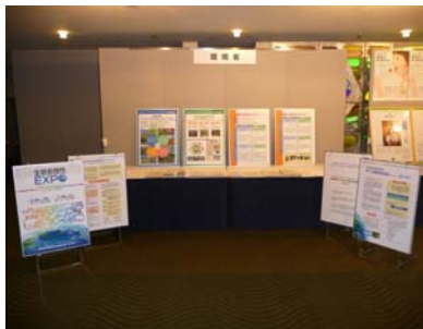
環境省の展示ブース

北海道銀行(北海道)、みちのく銀行(青森県)、青森銀行(青森県)、岩手銀行(岩手県)、東北銀行(岩手県) 七十七銀行(宮城県)、秋田銀行(秋田県)、北都銀行(秋田県)、荘内銀行(山形県)、山形銀行(山形県)、 東邦銀行(福島県)、常陽銀行(茨城県)、関東つくば銀行(茨城県)、足利銀行(栃木県)、群馬銀行(群馬県) 武蔵野銀行(埼玉県)、千葉銀行(千葉県)、千葉興業銀行(千葉県)、東京都民銀行(東京都)、 横浜銀行(神奈川県)、第四銀行(新潟県)、北越銀行(新潟県)、山梨中央銀行(山梨県)、八十二銀行(長野県)、 北陸銀行(富山県)、富山銀行(富山県)、北國銀行(石川県)、福井銀行(福井県)、大垣共立銀行(岐阜県) 十六銀行(岐阜県)、清水銀行(静岡県)、静岡銀行(静岡県)、スルガ銀行(静岡県)、三重銀行(三重県)、 百五銀行(三重県)、滋賀銀行(滋賀県)、京都銀行(京都府)、近畿大阪銀行(大阪府)、泉州銀行(大阪府)、 池田銀行(大阪府)、南都銀行(奈良県)、紀陽銀行(和歌山県)、但馬銀行(兵庫県)、鳥取銀行(鳥取県)、 山陰合同銀行(島根県)、中国銀行(岡山県)、広島銀行(広島県)、山口銀行(山口県)、阿波銀行(徳島県)、 百十四銀行(香川県)、伊予銀行(愛媛県)、四国銀行(高知県)、福岡銀行(福岡県)、筑邦銀行(福岡県)、 西日本シティ銀行(福岡県)、佐賀銀行(佐賀県)、十八銀行(長崎県)、親和銀行(長崎県)、肥後銀行(熊本県) 大分銀行(大分県)、宮崎銀行(宮崎県)、鹿児島銀行(鹿児島県)、琉球銀行(沖縄県)、沖縄銀行(沖縄県)