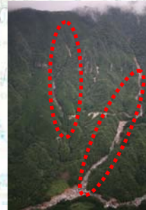
日之影町黒仁田1,2 溪間工:谷止工3基