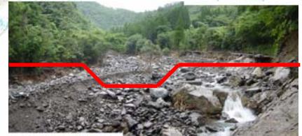
延岡市杉ノ内 溪間工:谷止工2基