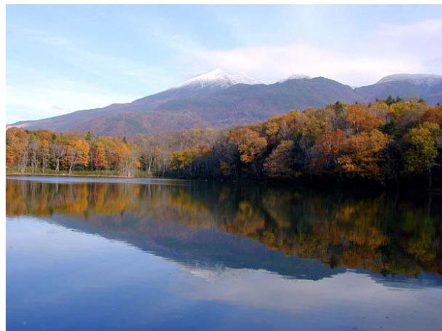
知床世界自然遺産の写真（上） 豊かな水をたたえる知床五湖の様子。 手入れの行き届いた複層林の写真（左） 下層木の成長に必要な光が林床に入っている。