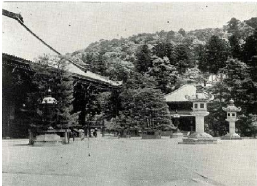
知恩院の前から望む東山国有林

このたび、京都市やNPO、学識経験者の参加による東山森林管理協議会を立ち上げることとし、森林づくりに係る地域の合意形成とモニタリングの体制を整備し、一般市民や民間企業等の参画を得ながら東山国有林での古都京都を彩る森林づくりを一層強力に推進していきたいと考えています。