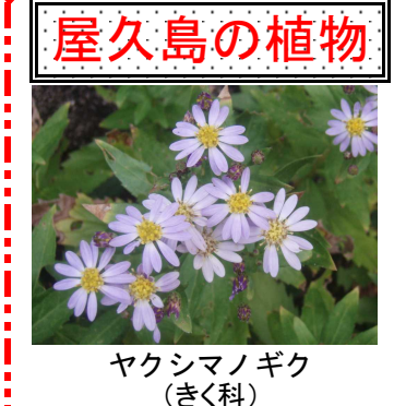
屋久島の植物 ヤクシマノギク (きく科)

横濱市議会の温暖化対 策委員会が調査研究のため ○月二〇日に屋久島森林管 理署を訪ね、調査と共用に 森林環境保全と利用に関 ついて視察が行われ、 ド「自然休養林」について 重要事項の調査結果を 要や森林環境保全の管 理に関する説明を行いました