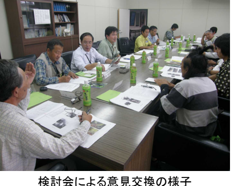
検討会による意見交換の様子

歴史的に、屋久島の自然を 九〇年代の観光客から さながら、自然を楽しま し、環境を保全し、自然 し、環境を保全し、自然 今年、国際森林年を記念 し、屋久島自然休養林を 校に自然休養林を利用し 森林教室を提案したと る、一月二日に小学校 足と併せ、一、二、三、 児童が、各自の持ち物 れ、屋久島特有の植物 森林や屋久島特有の植物 が、休養林内に散策して た。休養林内に散策して 九〇年代の観光客から さながら、自然を楽しま し、環境を保全し、自然 し、環境を保全し、自然