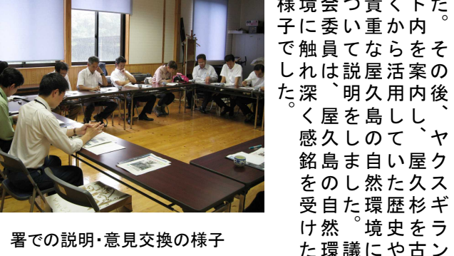
署での説明・意見交換の様子

是非ご覧下さい。屋久島の自然を 素敵の子供たちが、自然 が、休養林内に散策して た。休養林内に散策して 九〇年代の観光客から さながら、自然を楽しま し、環境を保全し、自然 し、環境を保全し、自然