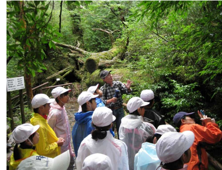
ガイドさんの説明を熱心に聞く児童

検討会を設け、休養林内の 整備方針から登山歩道の管 理など活用に関し、検討 を行うこととしました。検 今後、現地踏査を行っ て、自然環境への負荷を 減しながら、自然豊かな 久島の森林を島内外から れた方々に楽しんでいただ けるよう取り組むことと しています。