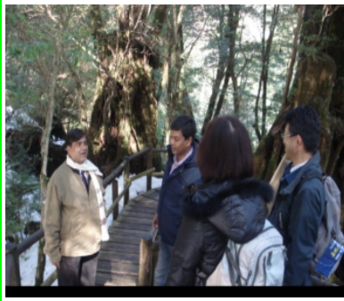
ヤクスギランド視察

は、さい、明題職、日、ンウ、か、イ、プ、し、は、名、環、 が、ま、さ、明、題、職、日、ンウ、か、イ、プ、し、は、名、環、 取、ま、さ、明、題、職、日、ンウ、か、イ、プ、し、は、名、環、 組、ま、さ、明、題、職、日、ンウ、か、イ、プ、し、は、名、環、 ん、ま、さ、明、題、職、日、ンウ、か、イ、プ、し、は、名、環、 で、ま、さ、明、題、職、日、ンウ、か、イ、プ、し、は、名、環、 る、ま、さ、明、題、職、日、ンウ、か、イ、プ、し、は、名、環、 シ、ま、さ、明、題、職、日、ンウ、か、イ、プ、し、は、名、環、 林、ま、さ、明、題、職、日、ンウ、か、イ、プ、し、は、名、環、 力、ま、さ、明、題、職、日、ンウ、か、イ、プ、し、は、名、環、 管、ま、さ、明、題、職、日、ンウ、か、イ、プ、し、は、名、環、 理、ま、さ、明、題、職、日、ンウ、か、イ、プ、し、は、名、環、 對、ま、さ、明、題、職、日、ンウ、か、イ、プ、し、は、名、環、 策、ま、さ、明、題、職、日、ンウ、か、イ、プ、し、は、名、環、