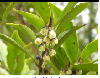
ヒサカキ (ツバキ科)

使、写、き、ほ、沢、六、の、 花、用、真、に、ど、が、cm、小、本、 期、さ、の、咲、か、あ、る、高、州、 は、れ、も、か、小、る、鋸、木、以、 三、る、の、せ、さ、な、初、が、葉、に、 下、こ、は、雄、白、春、あ、の、分、 四、も、株、雌、花、直、に、り、長、布、 有、あ、る、神、事、株、下、五、は、三、 に、で、向、mm、光、