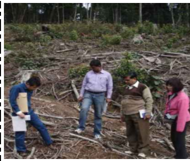
シカ対策事業実施箇所視察

た。は、い、め、の、問、管、か、危、の、さ、 高、る、管、特、が、理、ら、機、う、れ、 い、く、シ、理、に、さ、に、遺、ち、て、 関、心、力、を、担、研、ま、い、久、と、一、 を、策、当、修、し、た、さ、で、つ、 示、し、よ、て、い、野、ま、ざ、ま、 っ、て、い、捕、行、た、生、ま、 ま、獲、つ、た、生、な、遺、こ、 し、て、物、質、産、と、は、そ、