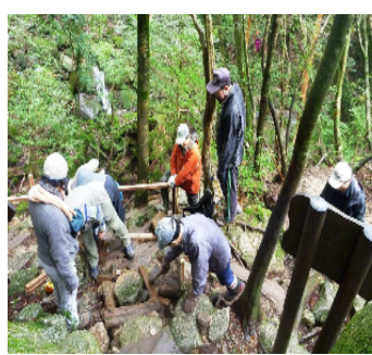
白谷雲水峡での清掃活動の様子

り、斜、谷、し、な、及、 ま、等、に、止、適、い、こ、ほ、 す、の、し、工、切、た、の、し、 。、治、縦、等、に、め、よ、す、 山、横、に、管、に、う、す、 事、浸、よ、理、は、な、 業、食、り、す、こ、と、 が、の、溪、る、森、を、 必、防、流、と、林、を、 要、止、を、共、を、起、 と、を、緩、に、造、こ、 な、図、傾、成、さ