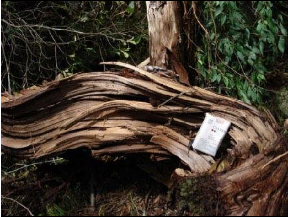
⑤辺材部分が裂けた様子(厚さ20cm弱)