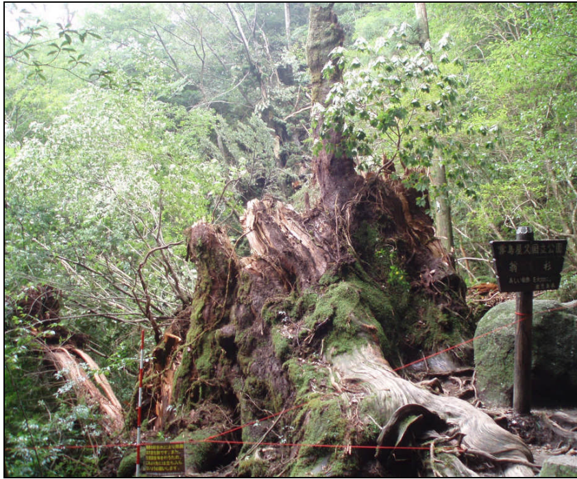
① 幹折れした翁杉の根元の様子(登山道側から)