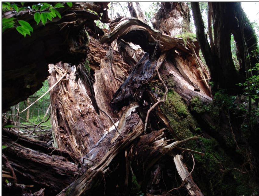
②折れた根元付近の腐朽の様子(下方向から)