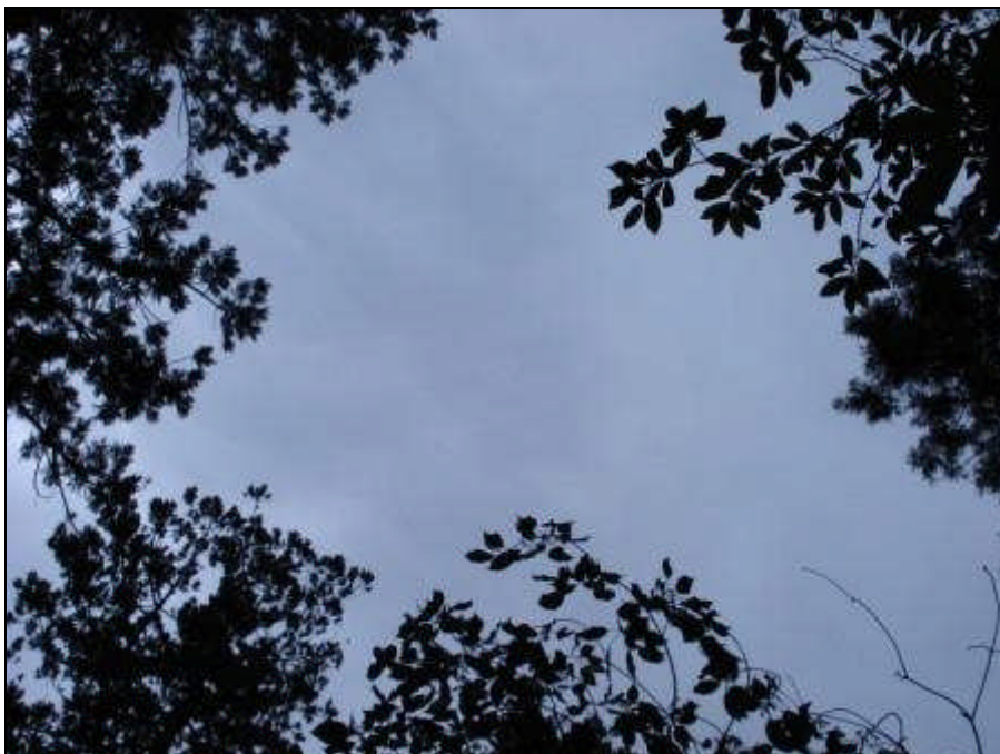
⑥空間環境の様子(根元部から)