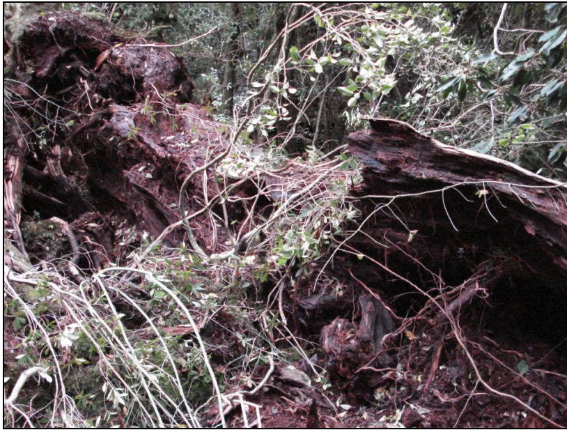
③中部位の沢に落ち込んでいる部分の様子