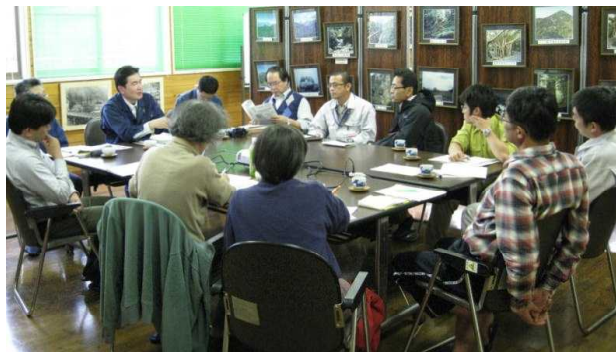
ヤクタネゴヨウ連絡協議会の様子