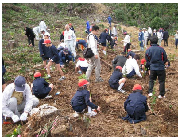
熊毛地区植樹祭の様子