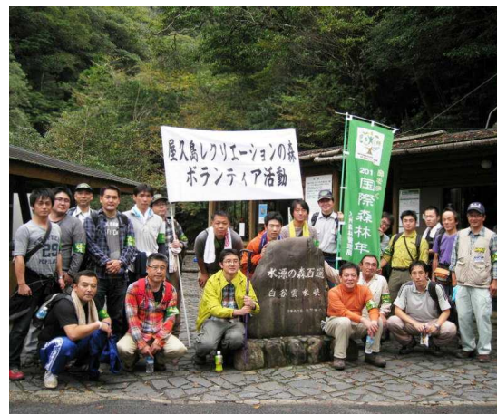
作業に参加したボランティア等