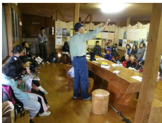
ヤクスギランドでの森林教室の様子