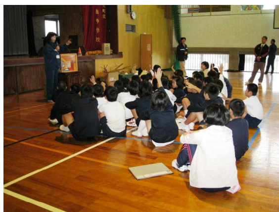
小瀬田小学校での森林教室の様子