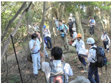
シカ被害現地調査の様子