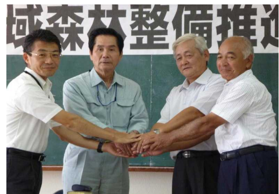
協定締結者による調印式の様子