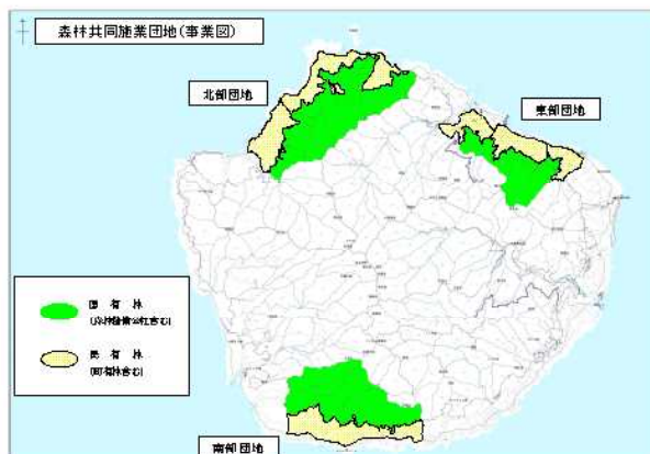
森林共同施業団地事業図