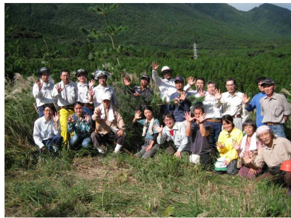
作業に参加したボランティア等