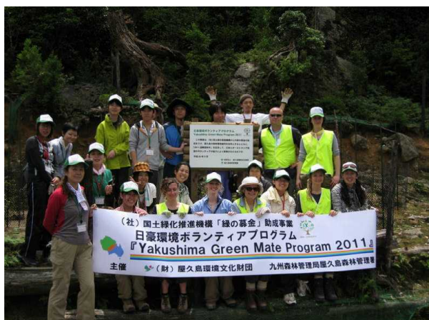
森林保全活動に参加した日豪ボランティア等