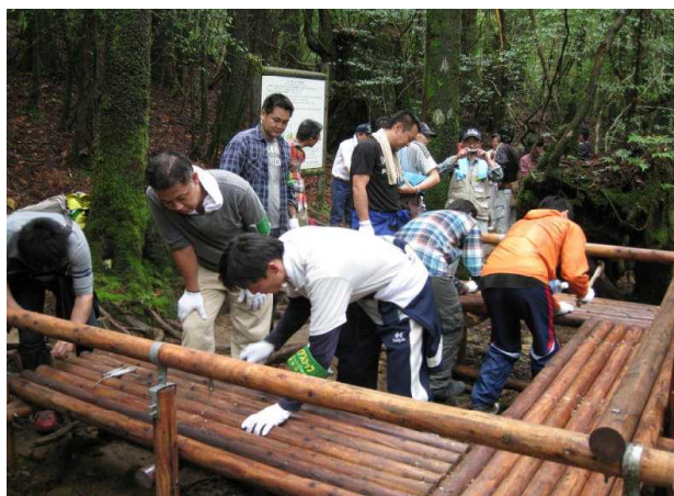
木製ベンチ作成の様子