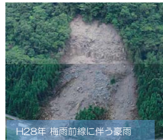
H28年 梅雨前線に伴う豪雨