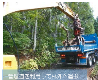
管理道を利用して林外へ運搬