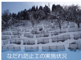
なだれ防止工の実施状況