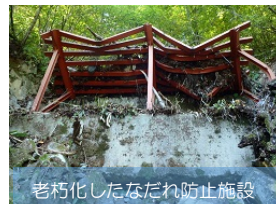
老朽化したなだれ防止施設