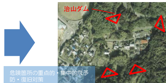
危険箇所の重点的・集中的な予防・復旧対策