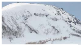
H29年 栃木県 なだれ災害