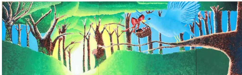
作品名 「朝日からの贈り物」 制作者 熊本市立 二岡中学校 美術部 3年生