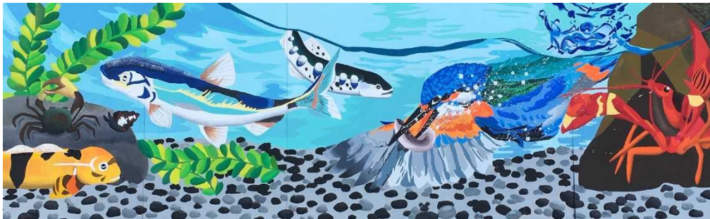
作品名 「生命 (いのち) の瞬間」 制作者 熊本市立 楠中学校 美術部 2年生