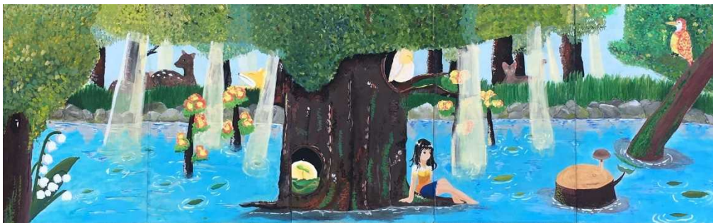
作品名 「森林の生命 (もりのいのち)」 制作者 熊本市立 清水中学校 美術部 2年生