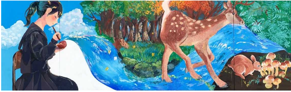
作品名 「山の恵み」 制作者 熊本市立 出水中学校 美術同好会 1～3年生