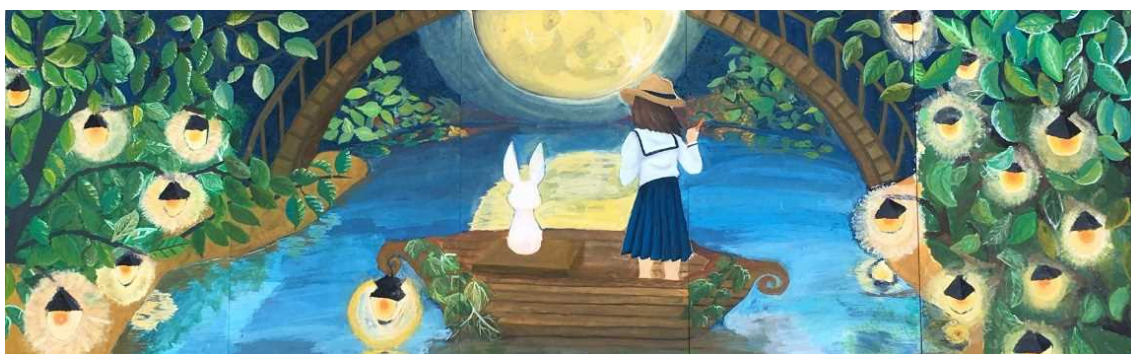
作品名 「神秘の森～少女と小舟～」 制作者 熊本大学教育学部 附属中学校 美術部 2年生

私達は、テーマである「山の恩恵」から『森』という自然の美しさと人との関わりをこの絵に表しました。月に照らされた若葉が輝く様子・森林は、私たちの心を豊かにしてくれます。