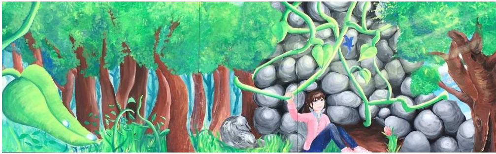
作品名 「朝露のしたたる森」 制作者 熊本市立 帯山中学校 美術部 2年生