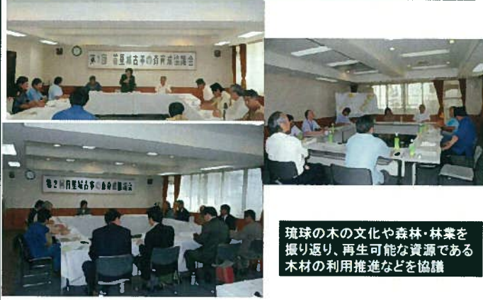
琉球の木の文化や森林・林業を振り返り、再生可能な資源である木材の利用推進などを協議