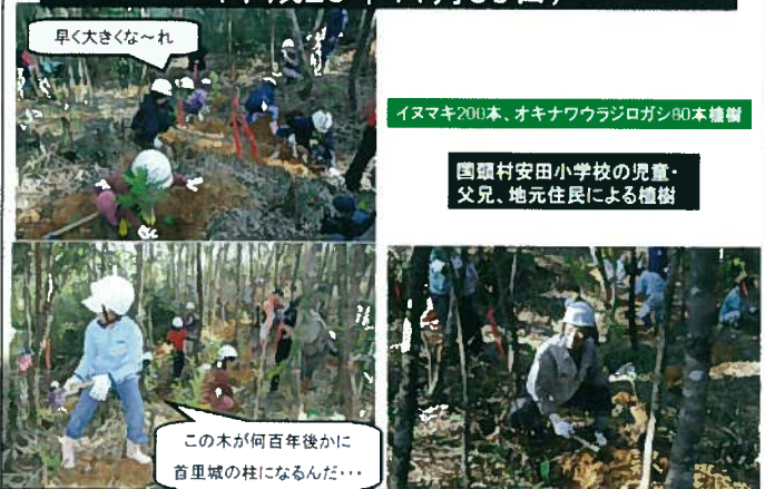
イヌマキ200本、オキナワウラジロガシ80本植樹