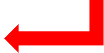
施工イメージ モルタル吹付状