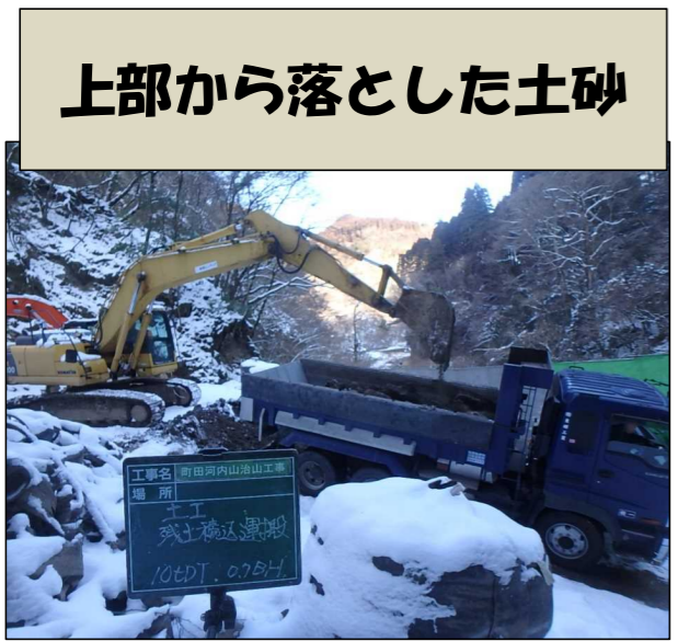
上部から落とした土砂

下記の写真は2月の現場の施工状況です。上部から落とした土砂を搬出すると同時に、法面に鉄筋を組む作業行いました。3月より法面の鉄筋を組んだところにモルタルの吹付けを予定しています。