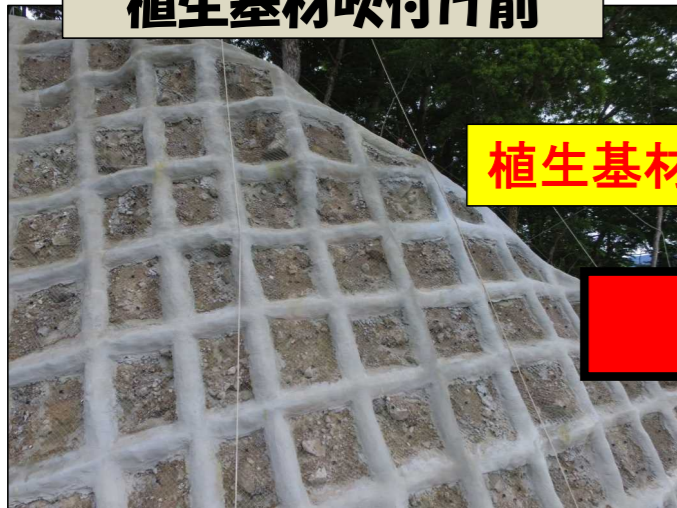
植生基材吹付け前