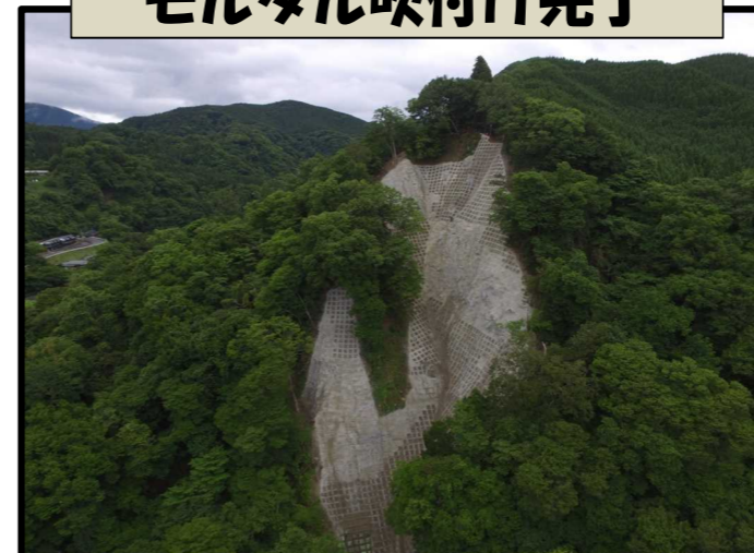
モルタル吹付け完了