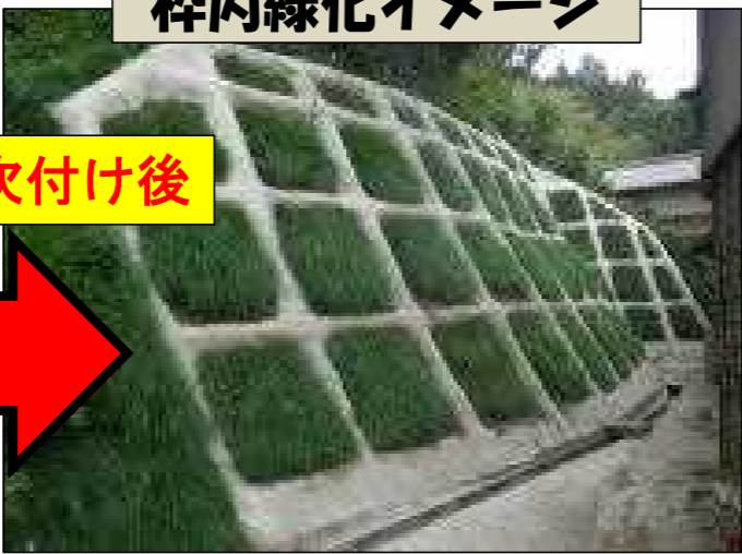
植生基材吹付け後