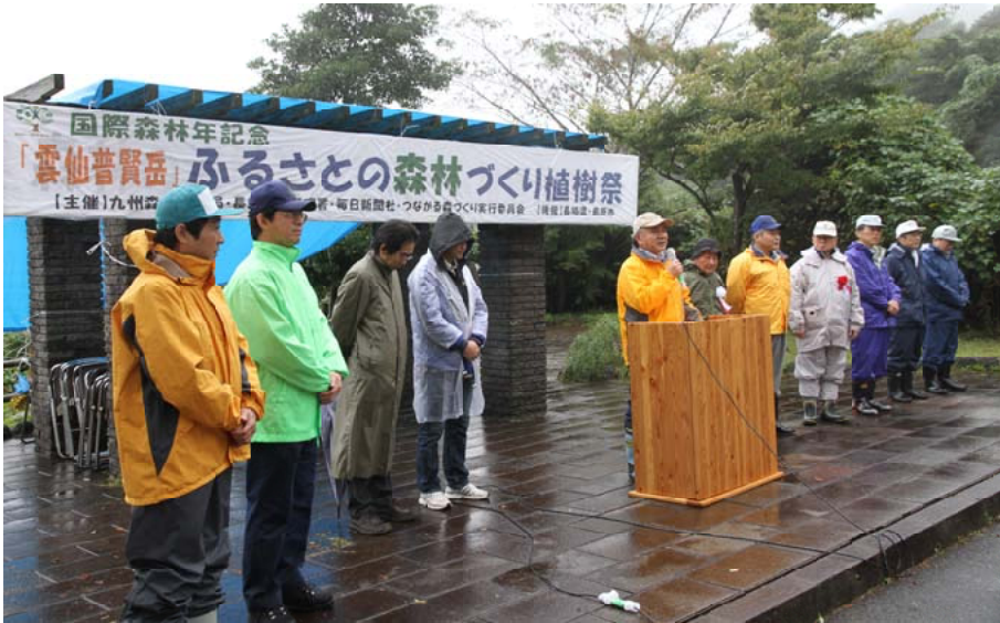
雨の中主催者代表挨拶を述べる平之山九州森林管理局長＝長崎県島原市おしが谷