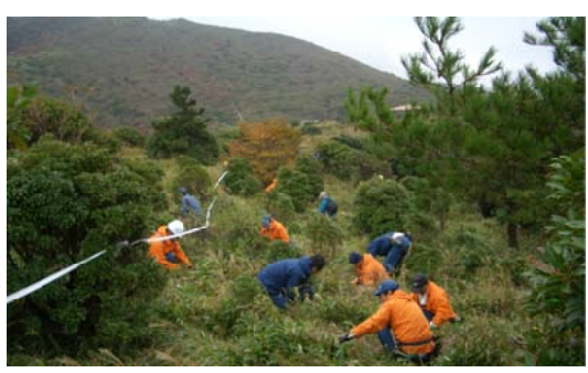
ササなどの刈り払いを行う参加者のみなさん