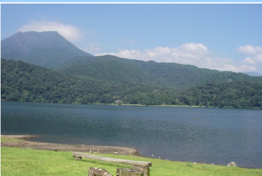
御池湖畔より高千穂峰を望む

神武天皇が幼少の頃、水辺で遊んだという伝説をもつ御池は、宮崎県都市と高原町との境界