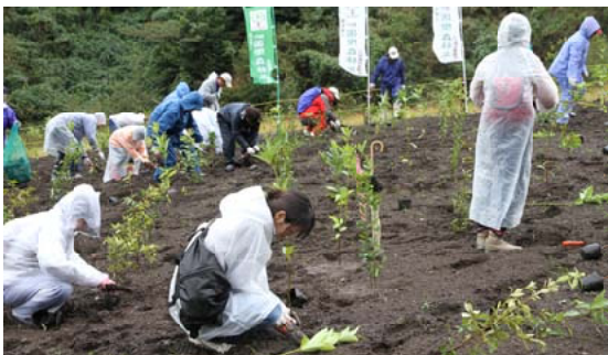
雨の中植樹を行う参加者のみなさん＝島原市おしが谷