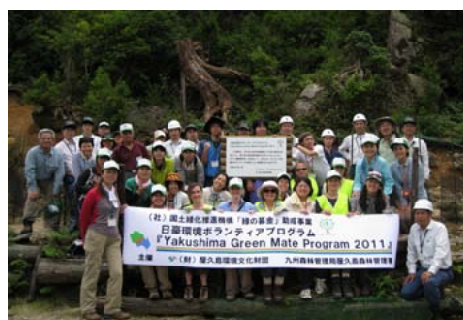
活動を終えて記念撮影するみなさん＝屋久島

日豪両国のボランティア20人が屋久島に滞在し、地元住民と屋久島の森林環境維持活動や希少種の保全活動を行いました。当活動は自然環境保全の意識向上や相互の交流を深めることを目的とし、(社)国土緑化推進機構助成事業として行われたもので国有林を活用した活動はヤクタネゴヨウの保全やスギ林保全作業を2日間に渡り行いました。一行は、下刈りや間伐を体験。爽やかな汗を流していました。