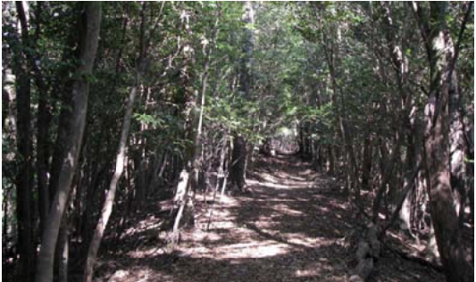
野鳥の森へとつづく散策路