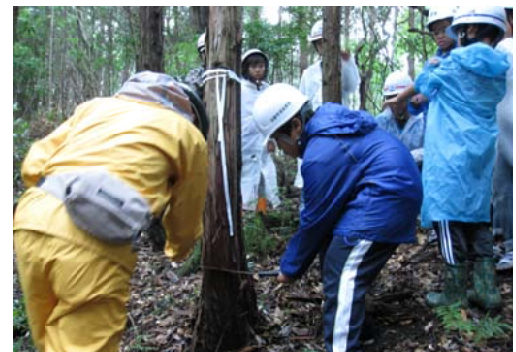
間伐木の伐倒に挑戦する児童ら＝熊本南部

【熊本南部森林管理署】人吉・球磨自然保護協会主催による体験林業を、球磨郡あさぎり町の松尾国有林内において行いました。当日は、人吉・球磨郡内から、緑の少年団やホイイスカウトが参加し記念植樹を実施。昼食後は3班に分かれ、当署職員の指導で間伐を体験しました。参加した子供たちは慣れない手つきで元氣よく手鋸を引き、夏休みの貴重な体験として汗を流