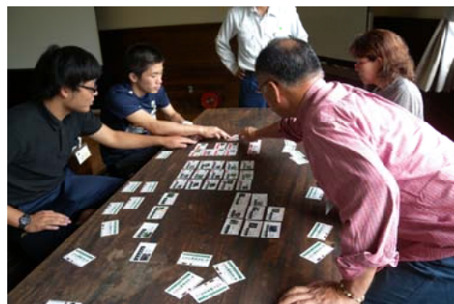
「カードゲーム」に挑戦する受講生のみなさん