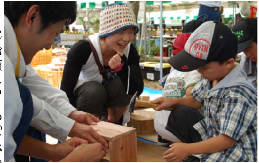
虫かご作りに挑戦する親子＝大分西部

【大分西部森林管理署】「森と湖に親しむ旬間」の一環として「耶馬溪ダム湖畔祭り」が行われ、杉板による虫かご作りを行いました。虫かごと一緒に力