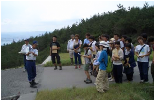
職員から説明を聞く鹿大生＝鹿久島

【鹿久島森林管理署】鹿久島大学農学部への依頼を受け、同学部生物環境学科の学生27人が桜島地区民有林直轄治山事業地で治山事業の研修を行いました。当日は引の平地区から八谷沢の治山施工地で、治山事業の意義・これまでの経緯、今後の施工予定、保安林における治山事業の重要性や有効性、砂防事業の違いを説明。学生から、「対岸から見る桜島は雄大だが、麓で暮らす人々の生活など考えたこともなかった。地元住民の暮らしを守る治山事業は、地形的・環境的にも非常に厳しいと治山事業の大切さを痛感した。」と感想がありました。