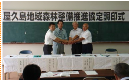
協定書に調印した各団体の代表＝屋久島

間伐方法や間伐材の販売、海上輸送など連携して森林整備を推進していくこととしており、今