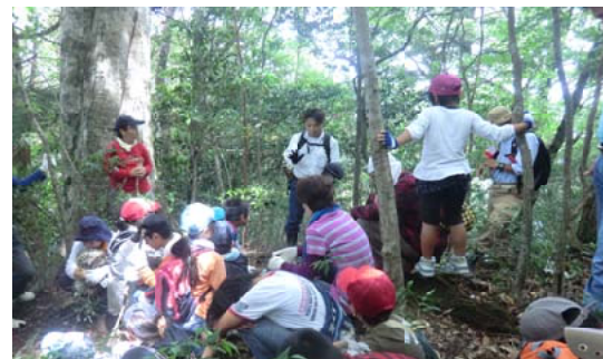
森林官から説明を聞く児童ら＝熊本

【熊本森林管理署】天香山登山道周辺で、山都町立清和小学4年生の児童や父兄37人を対象に環境学習を行いました。校長先生や森林インストラクターの案内で、ブナの大木を目指し、登山道を散策。途中、流域管理調整官が森林内のシカ被害状況の説明を行いました。目的地に到着した児童らは、清和森林事務所森林官から緑のダムや森林の効用について説明を受けました。また、川辺の生き物を調べたり水の検査を行い、参加した