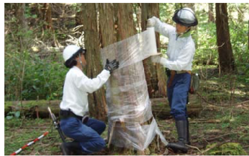
剥皮防止対策を行う職員＝大分西部

【大分西部森林管理署】当署では、管内のほぼ全域でシカ被害を受けており、防護柵や捕獲対策を行ってきましたが、被害は増加しており、シカ被害対策を署の最重点課題と位置付け取り組んでいます。先日、全職員が参加した。シカ被害防止対策では、各署で取り組まれている袋かけや剥皮防止の方法、クヌギのぼう芽食害や立木の剥皮被害の防止対策を実施。また、効果的な対象について意見交換を行いました。今後、被害状況