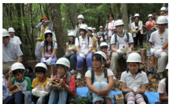
森林教室で説明を聞く参加者のみなさん＝佐賀

ていること、森林の効用などについて説明がありました。その後、全員で巣箱作りに挑戦し、出来上がった巣箱をみんなで協力して林内に掛けました。参加者からは「快適で気持ちよかったです。来年も参加したい」などの声も寄せられていました。なお、今回のイベントには、東日本大震災の被災地である宮城県から中学生と先生方が招待され、全国の参加者と一緒になって楽しく交流を深めておられました。