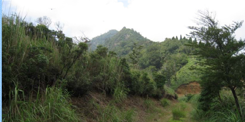
(下) 林道から見える山頂付近

では井戸内峠からのコースを紹介いたします。このコースは往復約3〜4時間程度で井戸内峠から北に延びる林道を40分程歩き登山口の杉林から急登な道を終えると6合目の稜線の上米良からの登山道に合流します。ここから緩やかな道が続き途中で伐採地があり、そこから市房山が目の前に広がります。しばらく歩くと登山道が北