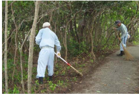
クリーン活動を行うボランティア団体＝宮崎北部

【宮崎北部森林管理署】日向市の「日向海岸風景林」と「お倉ヶ浜海岸林」で、海岸林のクリーン活動を行いました。真夏の厳しい暑さの中、日向市や宮崎県をはじめ、日向市ふるさと自然を守る会、関係ボランティア3団体や地区住民など2日間で約100人が参加。林内のゴミ拾いや、遊歩道の草払いに汗を流しました。回収したゴミは、300kgにのびりました。