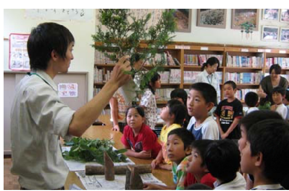
真剣に木の名前当てクイズに挑戦する児童ら。宮崎北部

【宮崎北部森林管理署】宮崎県椎葉村立尾向小学校の全校児童30人に、お届け講座「森林環境教育」を行いました。最初に材幹や枝葉に触れたり匂いを嗅いだりして樹木の名前や特徴などを学んだ後、木の名前当てクイズを実施。児童らはユニークな名前に楽しみながら挑戦していました。その後、下級生は、家族へ木製ハガキづくり、上級生は、シカと森林のカードを使ったゲームで、シカによる森林被害の深刻さを学びました。