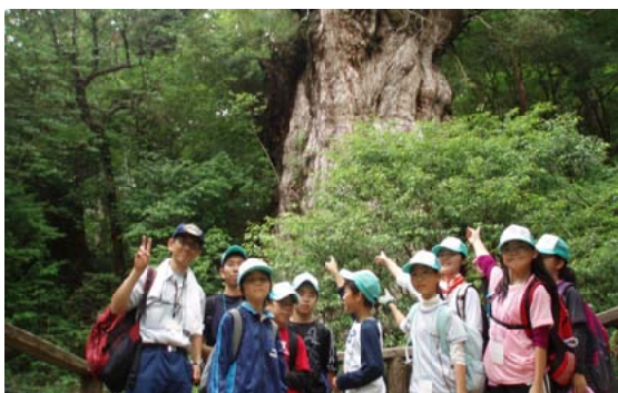
縄文杉をバックに記念撮影する「おおすみっこ探検隊」II屋久島