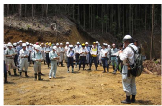
現地検討を行う関係者のみなさん 川宮崎

【宮崎森林管理署】活用型保育間伐の請負発注予定個所で局森林整備部の企画官の指導の下低コスト路網整備現地検討会を開催。県内の署や各事業体、関係者ら120人が参加しました。昨年度の路網検証会での意見を踏まえ、適正な線形をテーマに現地を踏査しての技術レベルの情報の交換を行いました。今回は、線形の検証と作設技術の向上を目的とした、第2回路網現地検討会を予定しています。