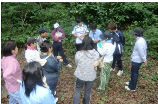
芳野みんなの森で職員から説明を聞く先生たち(熊本)

【熊本森林管理署】当署と遊々の森協定を結んでいる熊本市立芳野小学校の要請を受け、先生12人を対象に森林環境教育を行いました。はじめに、森林ふれあい係長が「遊々の森」の活用の仕方や、児童たちへの森林環境教育のすすめ方を説明。続いて「芳野みんなの森」の樹木についての説明や葉を用いたバツタ作りに挑戦しました。先生から、「この勉強を機会に2学期からの教育の参考にしてほしい」旨のあいさつがありました。