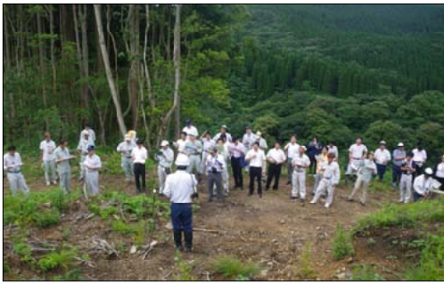
コンテナ苗について現地検討を行う参加者

2日目は、宮崎森林管理署管内石坂国有林に於いてマルチキャビティコンテナ苗植栽試験地を