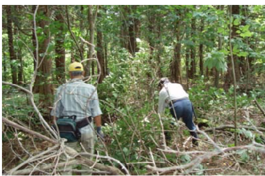
コンアブラの刈り出し作業をする保存会のメンバー（大分西部）

コンアブラの、色白な材色はうそかえの材料として他の樹木では代用できないということです。今年度は若い新会員を含め、刈出し作業に心地よい汗を流しました。