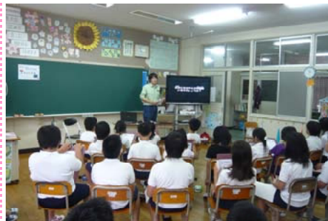
熱心に説明を聞く児童ら＝長崎

【長崎森林管理署】対馬市立神田小学校で3年生から6年生の28人にお届け講座を行いました。最初に、職員から「森林の大切さ」と、「ホタルの生態について」スライドを使って説明。児童らは、対馬だけに生息する「アキマドボタル」に、興味深く自然豊かな地域が自慢できること、そして、自然を大切にすることを理解してもらいました。