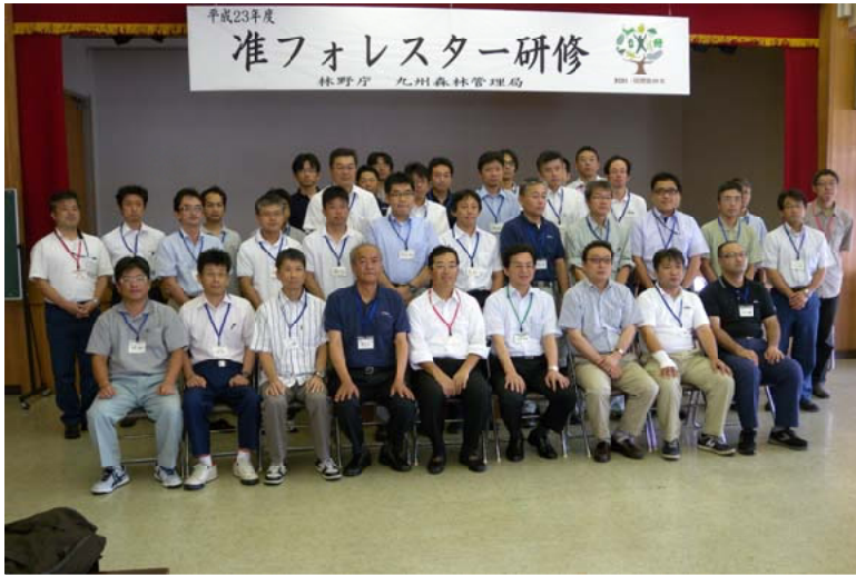
准フォレスター研修へ参加されたみなさん＝人吉市総合福祉センター