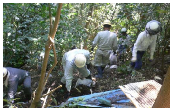
不法投棄物の回収を行う参加者のみなさん 都城支署

【都城支署】当支署の「クリーン活動」として、都城支高崎町の国有林で不法投棄物の撤去作業を都城市役所、旧高崎町内全公民館、土木協会宮崎支部・都城竹林業協同組合や地区住民など約60人が参加し、林内の不法投棄物を回収撤去しました。この機会に、不法投棄物の現状を見ていただき、国有林、民有林を問わず地域のみなさんで「森林」を守るための防止策に繋がればと思います。