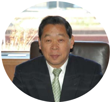
鹿児島県 日置市市長

本市は、鹿児島県の西部、薩摩半島のほぼ中央に位置し、東に県都鹿児島市、西は東シナ海に面しています。東シナ海に面する海岸線は、日本の渚百選にも選ばれた日本三大砂丘の一つ「吹上浜」が続く白砂青松の景勝地として広く親しまれています。