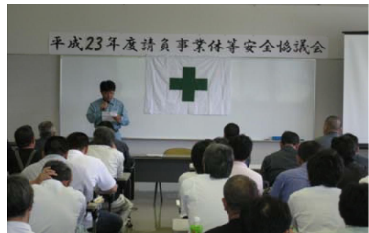
安全協議会へ参加した関係者＝大隅

【大隅森林管理署】事業実行中の請負事業者と事業担当者が一堂に会して安全協議会を開きました。事業体から、日ごろの安全活動の事例発表と今後の取り組みが紹介されました。また、鹿屋労働基準監督署安全衛生課長が労働災害の現状などについて講演。労働災害防止対策について再認識をしました。当署か