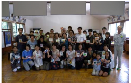
完成した作品を手にする受講者のみなさん

また、子どもたちの自然観察力や探求心を養う、「ジュニア樹木博士養成講座」の12回目を8月に実施する予定です。これは、森林内で児童5人に対し、講師として森林インストラクター