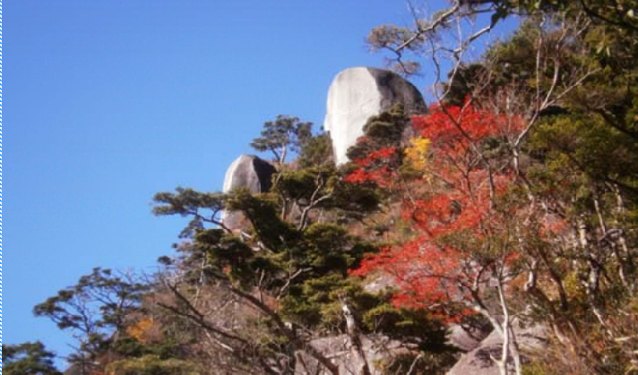
(上) 木積ダキより坊主岩を望む