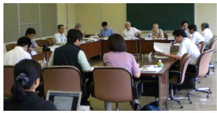
議題について審議する関係者のみなさん＝綾町役場