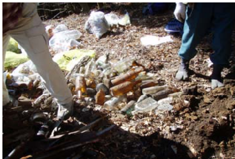
林内に放置されたピンやカン＝宮崎北部

り、高千穂町役場および高千穂山の会と協働で、清掃活動を行いました。ゴミは以前から投棄されたもので、シカ食害によって下層植生が減少し、見晴らしが良くなったことで発見されたものです。ピン・カン・錆び付いたトタンを掘り出し作業は1時間ほどで終了。参加者からは、「情報提供はありがたい。自分たちも協力はするが登山者のモラル向上にも努めてほしい」との声がありました。