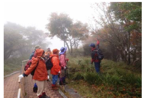
職員から説明を受ける参加者＝大分西部

【大分西部森林管理署】由布・鶴見岳自然休養林で近鉄・別府ロープウェイと共催で「鶴見岳紅葉探勝登山会」を開催、県内から47人が参加しました。参加者は4班に分かれ、当署職員の内により、鶴見岳山頂から馬