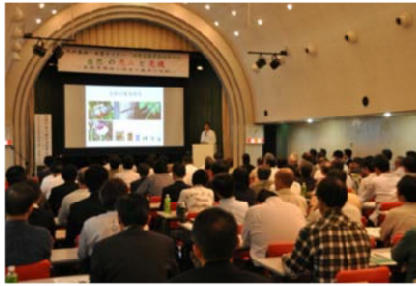
セミナーで講演を真剣に聞き入る参加者

10月17日、熊本市のレンガビル・熊本で「生物多様性」と「生物多様性の保全に果たす役割」など、国際生物多様性記念