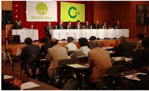
今後のシカ対応策について開かれたシンポジウム

増えすぎたシカによる林業や森林の生物多様性に及ぼす危機的な状況から、2月26日「九州森林環境シンポジウム」が開かれ、専門家から報告をいただき、今後のシカ対応策についてパネルディスカッションが行われました。