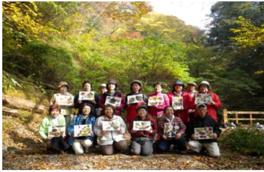
作品のフィルムルックスを手に喜ぶ参加者

11月7日、第2回九州森林倶楽部「清水谷の紅葉を訪ねて」を実施。参加者17人が熊本県菊池市の菊池溪谷を訪ねました。企画を行った九州森林インストラクター会のメンバーらが案内、真っ赤に色づいたイロハカエデやコハウチワカエデなどを観察しながら秋の深まる溪谷を楽しみました。