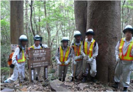
歩道修理を終え大ケヤキの前で＝長崎

【長崎森林管理署】10月19日～21日の3日間、長崎県立諫早農業高校環境創造科2年生6人を受け入れインターシップを行いました。生徒は、最初に国有林野情勢や管内概要の説明を受けた後、治山事業実行個所や保育間伐現場を見学。また、歩