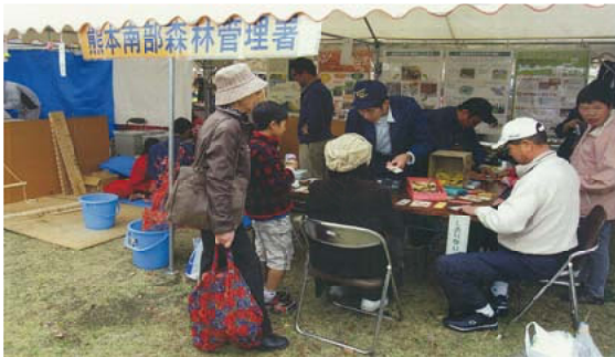
しおり作りに挑戦する参加者＝熊本南部