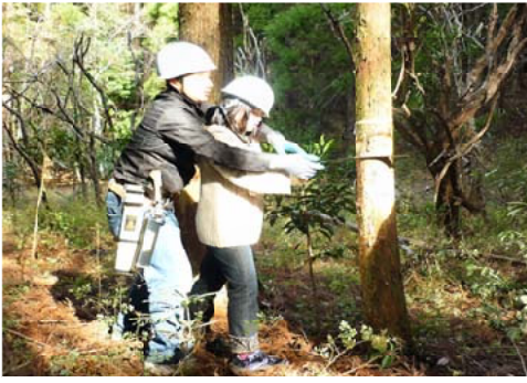
復元作業の抜き刈りに挑戦する参加者

参加者は、綾の照葉樹林や作業の目的、安全作業の手順などの説明を受けた後、宮崎森林管理署職員などの指導のもと作業