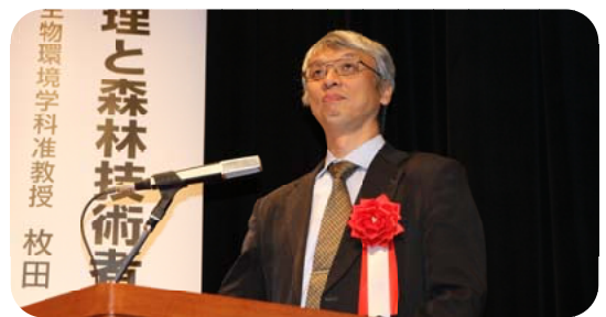
特別講演を行う鹿児島大の枚田准教授