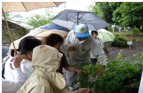
葉の構造について説明を受ける受講生

熊本市にある監物台樹木園で実践・公開講座「葉の構造を学ぶ」「絵手紙」「クラフト(踏み台)」「草木染め」を開きました。