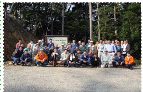
保護活動に参加した関係者＝西都児湯