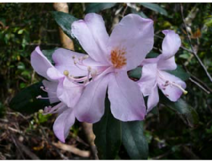
西表島に自生する「セイシカの花」

入り口近くの歩道は集落の水源地への道路として利用されていることから道幅は広くなっていますが、すぐに相良川を渡河することとなります。西表島の登山は、登山靴よりハブとヒル対策を考慮すると長靴がだんぜんお勧めです。水源地を過ぎると、歩道の道幅は狭くなり、クロヘゴなどの下層植物が歩道を覆っていますので、足下を確認しながら進むこととなります。途中、オキナワウラジロガシなどの亜熱帯林やヤエヤマオオタニワタリなどのシダ類が見れ植物に興味のある方にはたまらないコースだといえます。