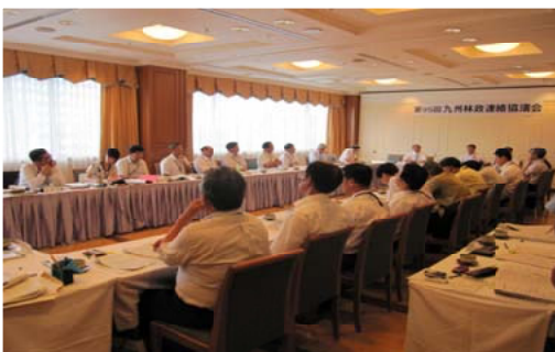
協議会へ参加した九州各県の関係者

鹿児島市と鹿児島県薩摩川内市で2日間に渡り、第95回九州林政連絡協議会が開かれ、林野庁をはじめ九州各県や関係機関の関係者約40人が出席しました。