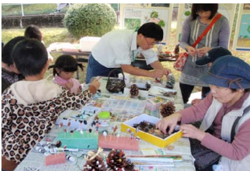
ツリー作りに取り組む参加者＝宮崎北部

【宮崎北部森林管理署】森林・林業への理解を深めていただくことを目的に「森とむらのフェスティバル」が東臼杵郡美郷町の宮崎県林業技術センターで開かれ、当署は、どんぐりやまつぼっくりを使つてのツリー作り体験やシカと森のカードを作つての体験コーナーなどを行いました。ツリー作り体験コーナーでは、子どもから大人まで楽しそうにツリー作りに取り組んでいました。また、シカと森のカードの体験では、現在の森の状況を知っていただくことが出来、体験者から、「学校などで取り入れられないのか」との意見もあり、森林・林業への理解を深めることが出来ました。