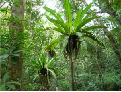
亜熱帯林特有の「ヤエヤマオオタニワタリ」

西表島は東京から2100キロ、沖縄本島から430キロ離れた洋上にあり、古見岳を最高峰に300〜400級の山々が連立しています。古見岳は地元では信仰の対象となっており、登山ルートは、相良川沿いに登るコースとユツン川沿いに3段の滝を通過して行くコースがあります。山頂までの登山道はあまり整備されておらず、特に、ユツン川コースは迷いやすく地元のガイドが必要となりますので、相良川コースを紹介します。