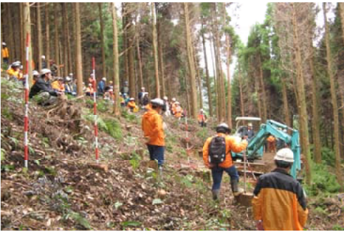
オペレーターの作業を見学する参加者＝大隅

【大隅森林管理署】南大隅町に位置する大鹿倉国有林内において、県や森林組合、林業事業者の職員など107人が参加し、低コスト路網現地研修会を行いました。はじめに、当署職員が路網の線形の考え方や丸太組の作設方法などについての説明。