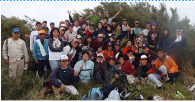
古見岳登山で山頂に着いた地元中学校の皆さん

我が署の管轄する国有林は、大別して「やんばる」と呼ばれる沖縄本島北部地域と八重山諸島の「西表島」に区分されます。沖縄県で一番高い山は石垣島の「於茂登岳（標高596.6m）」ですが、石垣島に国有林は無く、二番目に高い山が西表島の「古見岳（標高469.5m）」です。今回は、西表島の最高峰である古見岳を紹介します。