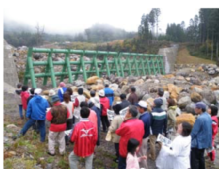
谷止め工を見学する参加者＝宮崎北部

る災害地の復旧個所の谷止め工設置状況や県施工砂防施設のスリットダムを見学しました。参加者は、今回の体験ツアーに大変満足していました。