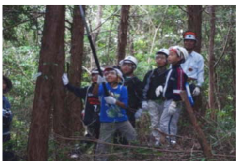
枝打ちに挑戦する児童ら＝熊本