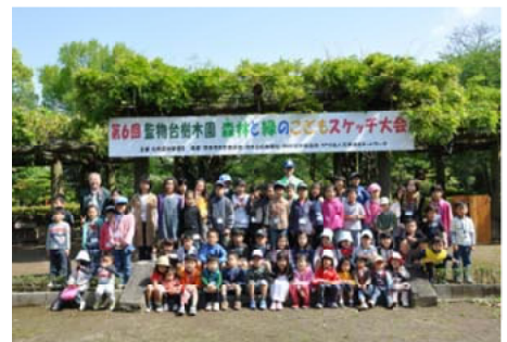
緑のスケッチ大会へ参加したみなさん

緑の月間行事として、熊本城内の一角にある監物台樹木園で「第6回森林とみどりのスケッチ大会」を開き、34組の幼児、小学生と保護者など105人の親子が参加しました。また、熊本市立託麻原小学校の緑の少年団による苗木の無料配布も行われました。