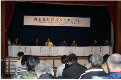
西表島の森林環境について報告を聞く参加者

1月16日、沖縄県八重山郡竹富町の竹富町離島振興総合センターにおいて「西表森林環境シンポジウム」が開かれました。これは西表島における森林環境の保全や利用など、これまでの取り組みを踏まえ考えるもので関係者を含め約100人が参加し、活動報告や基調講演、パネルディスカッションが行われました。