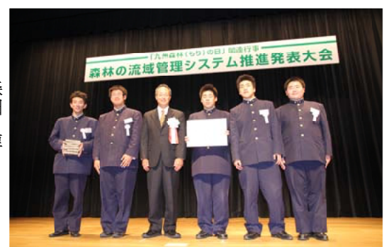
九州森林管理局長賞＝大分県立日田林工高等学校

◇諫農 屋上緑化の取り組み 古畳を活用しての経済性と効率的な植物栽培を目指して 長崎県立諫早農業高等学校 植松和也