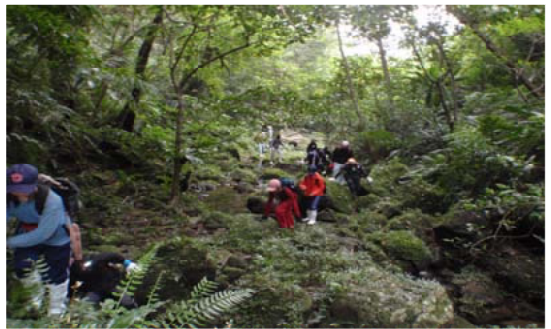
古見岳登山に挑戦する生徒および父兄のみなさん

歩道は急傾斜となり、急傾斜の歩道が一息つくとも斜面が緩やかになり崖の上の滝見台にでます。そこから「無名滝」が見れ、しばしの休憩地となります。標高400mから山頂付近は、リュウキュウチクが密生しており踏み後だけが通行できるほどです。山頂からは天気が良いれば、黒島、新城島など八重山の島々を見渡すことができ、最高の大パノラマが目を楽しませてくれます。