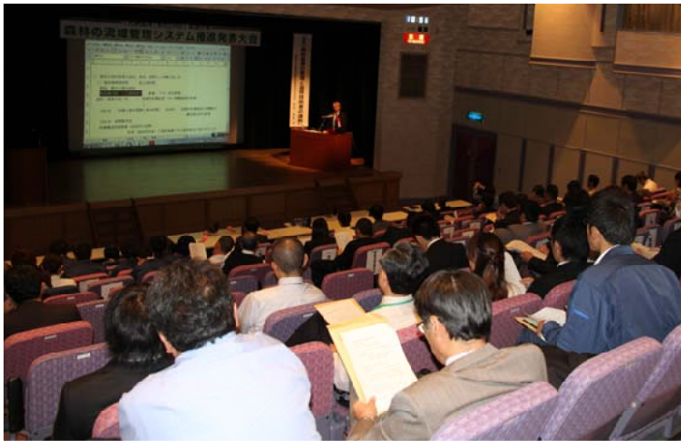
一般の部20課題・高校生の部5課題を発表＝熊本市国際交流会館

同発表大会は、九州林政連絡協議会が主催し「九州森林の日」の関連行事として、森林・林業関係者や高校生などが日ごろ取り組んでいる林業技術・流域管理・業務改善などの成果を発表し、技術の交流や情報交換を行い流域の森林・林業の活性化を図ることを目的に開いているもので、今回で16