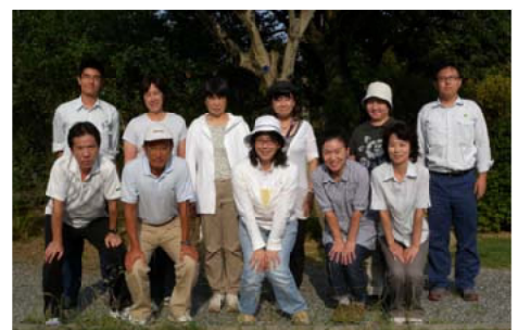
「森の塾」へ参加した小学校の先生方

8月23日、熊本市の監物台樹木園で熊本県内の小学校教諭を対象に、森林・林業について学んでいただき、学校での森林環境教育に活かしていただくことを目的に「森の塾」を開き、8人の先生が参加しました。