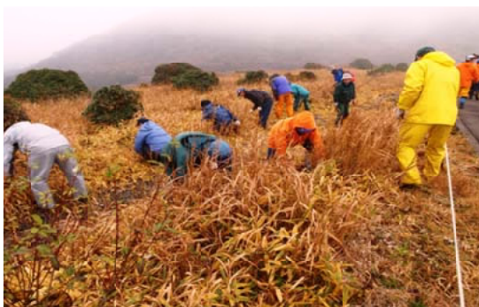
刈りだし試験地の刈り払いをする関係者＝大分西部

当署職員をはじめ、環境省・くじゅう保護官事務所、九重の自然を守る会、九重・飯田高原観光協会から52人が参加し、ミヤマキリシマ群落の樹勢や開花の回復を願いながら、手鎌で丁寧にササ類の刈り払いをしました。