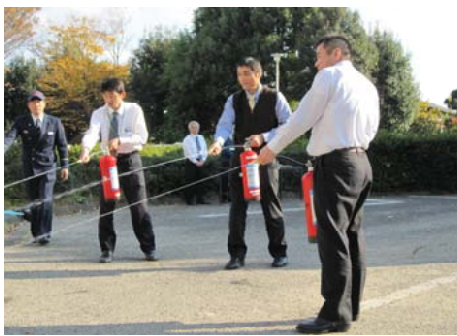
初期消火訓練を体験する職員

当日は熊本市中央署消防署の方々に協力をいただき、局職員はもとより、耐震工事関係者なども参加し、火災発生時の通報や初期消火、避難誘導など本番さながらの訓練を実施。職員は消火器を使った初期消火の訓練などを体験しました。