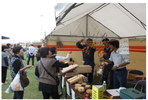
手作り木工品が人気＝西都児湯

【西都児湯森林管理署】産業と観光振興を目的に、「さいとふるさと産業まつり2010ここんねまつり」が開かれ、当署からは、職員手作りの木工品を出品し、緑の相談窓口を設け、一般客からの相談に対応しました。当日はあいにくの天気でしたが、口蹄疫の防疫措置で苦勞された農家の皆さんも復興と再建をアピールのため多数参加され、賑やかなまつりとなりました。