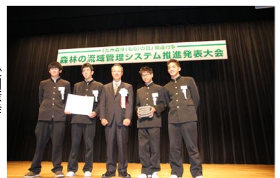
九州森林管理局長賞＝長崎県立諫早農業高等学校