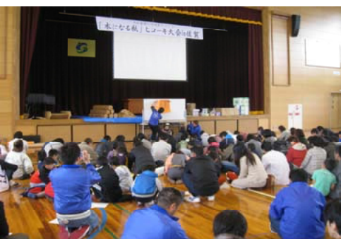
紙ヒコキ折り方に取り組む参加者