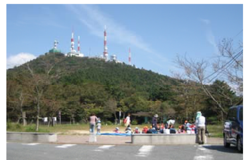
8台目付近の皿倉山平