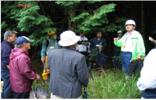
現地で説明を聞くモニター会議参加者の皆さん

し、ノカイドウの保護柵設置箇所を視察しました。野生鳥獣であるシカが慣れし、当然のように周辺を行き来している状況を見て、参加者は驚きの声をあげていました。また、笠松式くくり罾の説明と実演には興味津々に見入っていました。