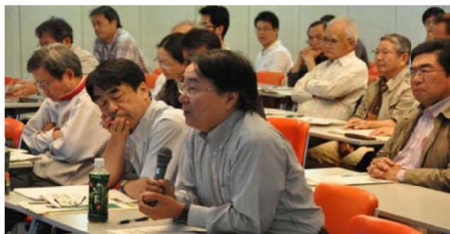
講演後意見交換会で意見を述べる参加者

セミナーには一般市民や行政関係者など約130人の参加があり、参加者からは「生物多様性と私たちの生活との関わりやその重要性がよく理解できた。林業と生物多様性の両立が必要」などの声が聞かれました。 (担当：指導普及課)