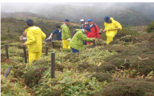
立ち入り規制柵を設置する関係者=大分

うの自然に感謝する日」活動の 一環として、久住山国有林の扇ヶ 鼻において、関係機関、地元ボ ランティア団体など総勢26人で、 登山道外への立入り規制ロープ 柵を設置しました。扇ヶ鼻には ミヤマキリシマが群生しており、 多くの登山者が訪れます。この ため、登山道以外への立入によ る踏付けや接触により、ミヤマ キリシマの被害が多く見受けら れることから、それを防止し、ミ ヤマキリシマを復活させる目的 で実施したものです。これから も関係者が協力し、高山植物の 保護活動に取り組むこととして います。