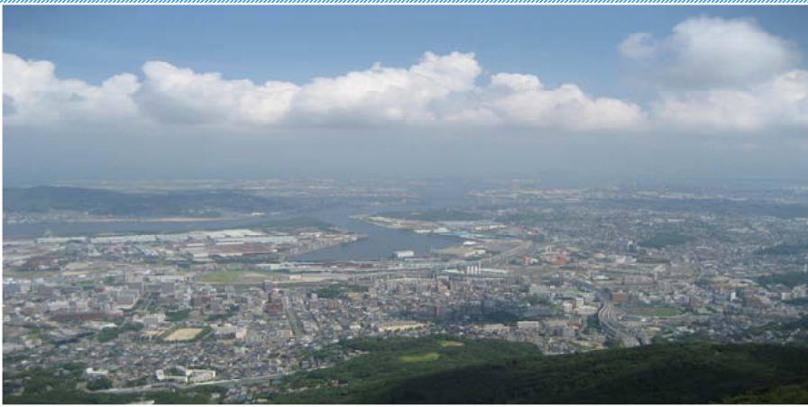
(上) 皿倉山山頂から眺望する北九州市街地 (下) 権現山より皿倉山頂を望む

地的・歴史的環 境の中、北九州 重工業地帯とし ての都市構造が もたらす山麓地 帯の発展に伴い、 取り巻く森林地 帯のいち早い保 安林指定、北九 州自然休養林、 北九州国定公園 特別地域、鳥獣 保護地区など、 地域住民の生命 財産を守る為の 森林政策が求め られ、その使命 を果たすべく、 公益的機能を重 視した森林施業 および都市近郊 林としての森林