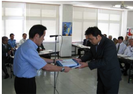
交通安全功労団体を受賞＝宮崎署