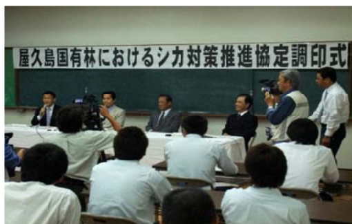
調印式に参加した関係者＝屋久島

【屋久島森林管理署】屋久島で問題となっているヤシカによる農林業被害および生態系被害の防止を目的として屋久島森林管理署、屋久島町、上屋久・屋久町両猟友会はシカ捕獲を効率的に進めるための協定を結びました。10月13日の調印式には、各機関の長が参加しました。このように複数の機関が連携した取り組みは、九州では初めてであり、今後はシカ捕獲作業がスムーズに進むことが期待されるとともに、地域住民等の声を積