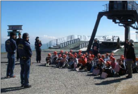
肌寒い中での話しに熱心な子供ら＝宮崎北署

【宮崎北部森林管理署】五ヶ瀬ハイランドスキー場周辺において、五ヶ瀬町内の小学生を対象にお届け講座を行いました。標高1600mの現地は、肌寒