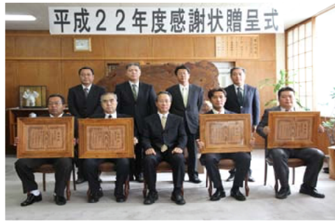
感謝状を手に喜びの皆さん

10月28日、森林管理局長室において平成22年度の国有林材販売協力者に対して感謝状贈呈式