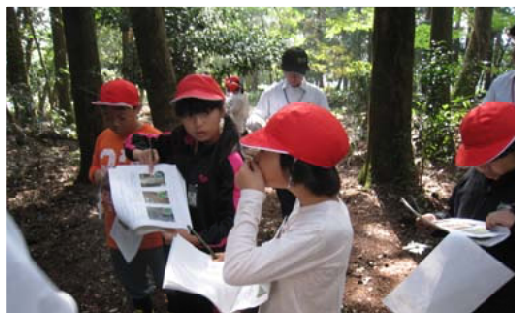
真剣に問題シートに取り組む児童＝都城