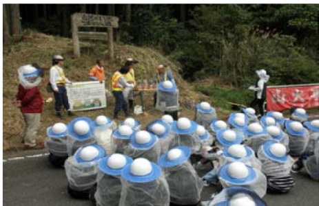
保護具を着用し熱心に聞き入る児童＝佐賀署

【佐賀森林管理署】神崎市立脊振小学校5・6年生の森林教室を行いました。はじめに児童らは、森林がダムであることを署員が森林の土と水とを用いた実験により学習。次に、スギ林では、胸高直径と樹高を測定する森林調査を体験。また、ヒノキ林では保育間伐の伐倒を見学しました。児童からは、森林がダムの働きをしていることや山の仕事について理解できたなどの感想が聞かれました。