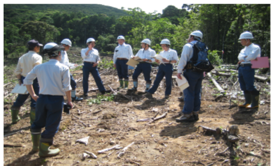
現地にて検討を行う関係機関のみなさん＝屋久島