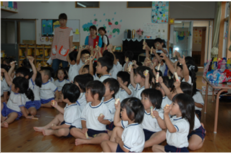
紙芝居を楽しむ園児ら＝宮崎南部

幼稚園において、幼稚園から保育園児90人を対象に、紙芝居「森林からのおくりもの」とキーホルダー「モックン」作成の二つのプログラムで森林教室を行いました。紙芝居では、動物たちの食べ物、きれいな空気や水が森林からのおくりものと言った話に、園児たちは、目を輝かせて聞いていました。また、「モックン」には動眼を付け、口を書いたり、小さな歓声が上がっていました。当森林教室は、木や緑と触れ合う機会や、木や緑の大切さを教える目的で幼稚園からの要請で行ったもの。今後も、緑の大切さを学んでもらえるよう取り組んでいくこととしていきます。