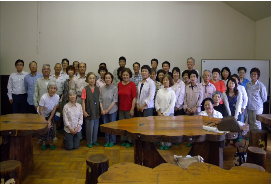
第1回実践公開・講座に参加した受講者及びスタッフのみなさん＝監物台樹木園「みどりの交流館」