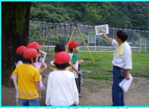
クイズに挑戦する児童ら＝宮崎北部

象に「お届け講座」を行いました。まず、教室で、「紙芝居」による「森林の働きと役割」や「山ではたらく人々の仕事」についての説明を行い、続いて「木の名前当てクイズ」では、全員が元気に手を挙げて問題に答えていました。さらに、校庭の「樹木名や特徴を覚える」コーナーでは、木の葉など、職員手作りの資料をヒントに名前を覚えようと真剣に取り組んでいました。質問コーナーでは、日本の山で働く人はどのくらい、など数多くの質問が出されました。全員が積極的に参加し、「森林のはたらき」や「森林の大切」さな