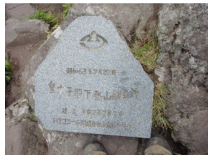
開聞岳山頂にある皇太子登山御立所

客で賑わい、天気の良い日の山頂からの眺めは360度の展望ができ、佐多岬や桜島そして霧島連山が見渡せ、まさに「絶景」の一言に尽きます。