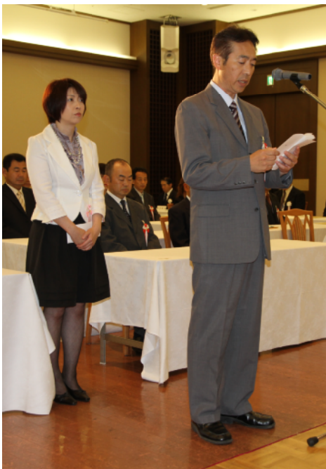
受賞者を代表して謝辞を述べる 国有林野管理課の鹿田技官