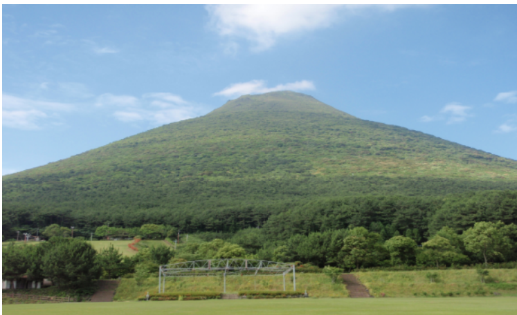
池田湖からの開聞岳遠望（上）