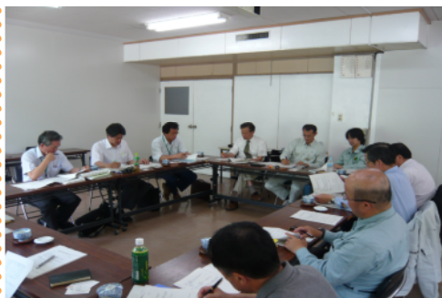
運営会議を開催する関係機関＝長崎

佐賀森林管理署としては情報の眼がたくさんでできることになり、また高齢者は「通信員」として情報を提供することによって虹の松原の保全に貢献しているという満足感が得られたいです。 (佐賀県佐賀市在住)