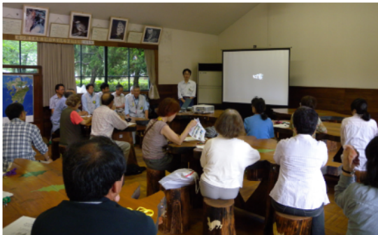
石神指導普及課長の説明を聞く受講生の皆さん

「森林のさまざまな働きや大切さ」を一般の方々に理解していただくため、熊本城の一角にある監物台樹木園において、年6回の実践公開・講座を計画しています。