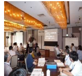
中央研修との関係