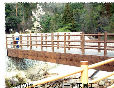
木調の橋とコンクリート床固工