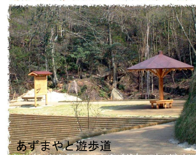
あずまやと遊歩道