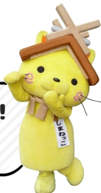
島根県観光キャラクター「しまねっこ」