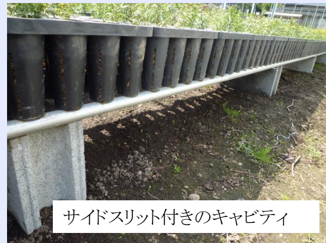
サイドスリット付きのキャビティ