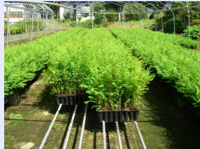
棚(育苗ベンチ)利用で、確実な空中根切りや過剰水の排除、病虫害発生回避・低減、雑草の防除などのメンテナンス低減