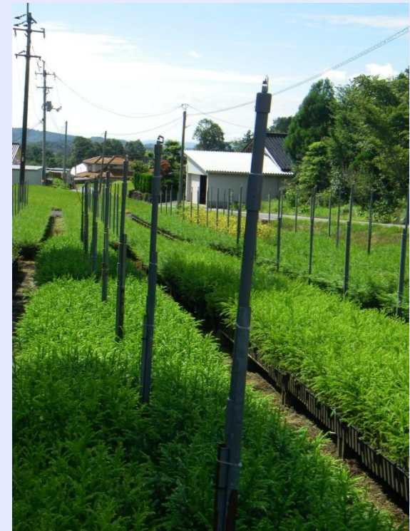
育苗ベンチと散水施設の配置の例