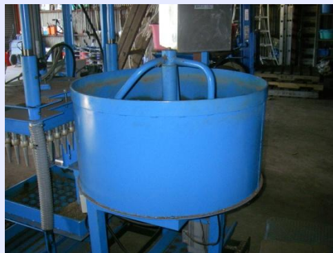
培土に水を加えて攪拌