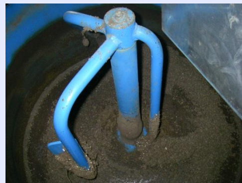
培土100ℓに対し、水8ℓ程度を 加えて攪拌