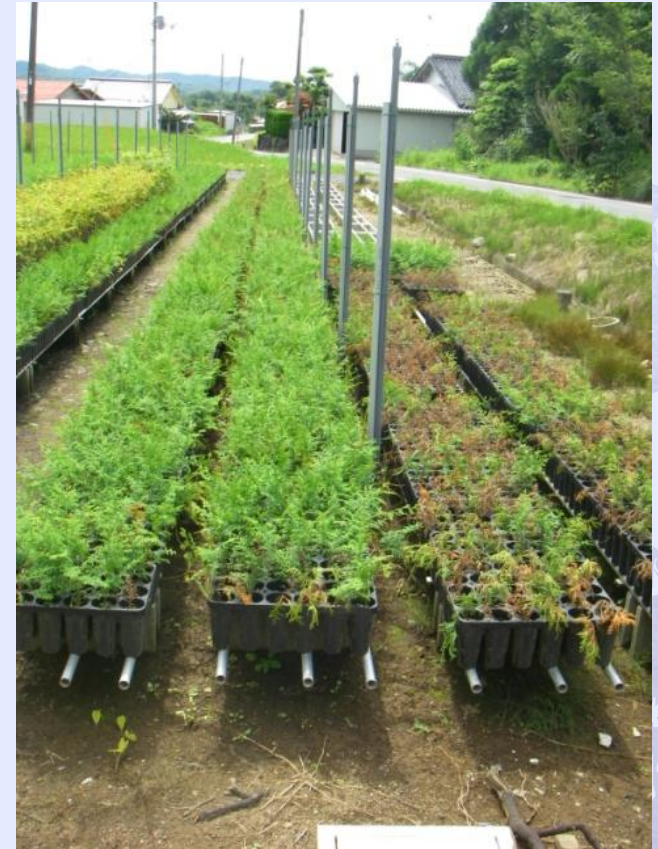
夏期の移植試験の例

→ 移植可能時期が長いと、労力、施設や資材(コンテナ)等の効率的な利用・配置が可能となる(生産コストに反映)。