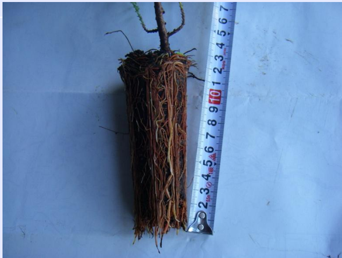
植え付け後、土壤に接する面となる根鉢の外周に満遍なく細根等の根が配置