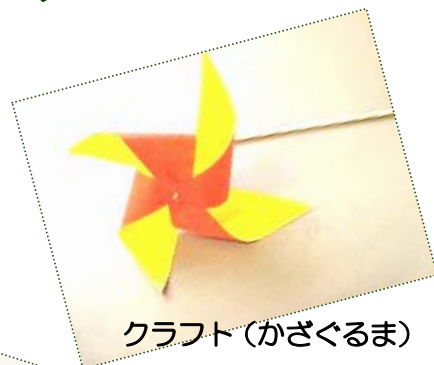
クラフト(かざぐるま)