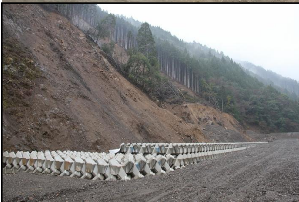
護岸工 完成状況(下流より)