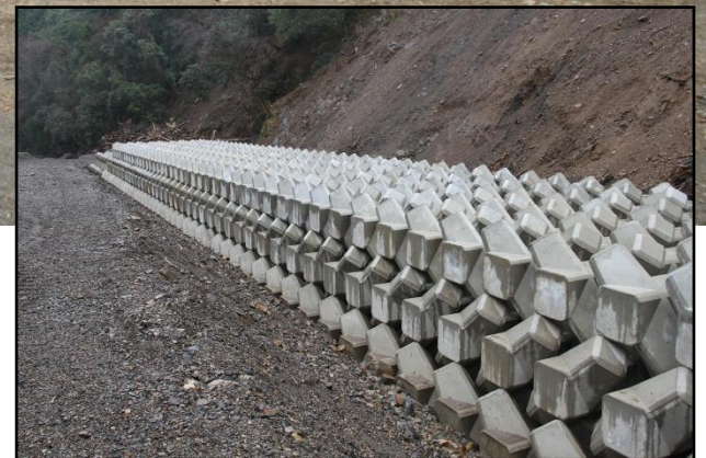
護岸工 完成状況(上流より)