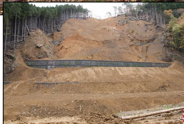
鋼製砕土留工 完成状況