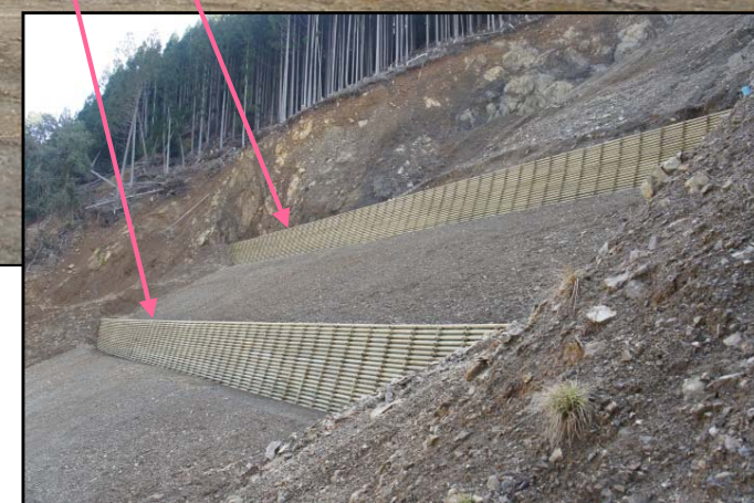
木製土留工 完成状況