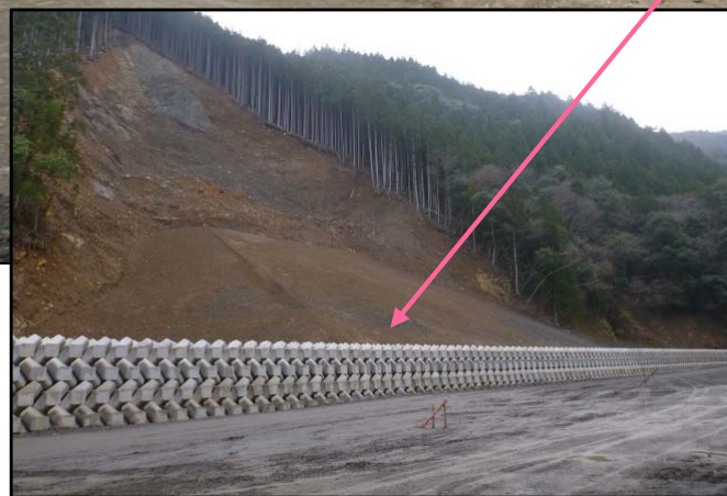
コンクリートブロック護岸工 完成状況