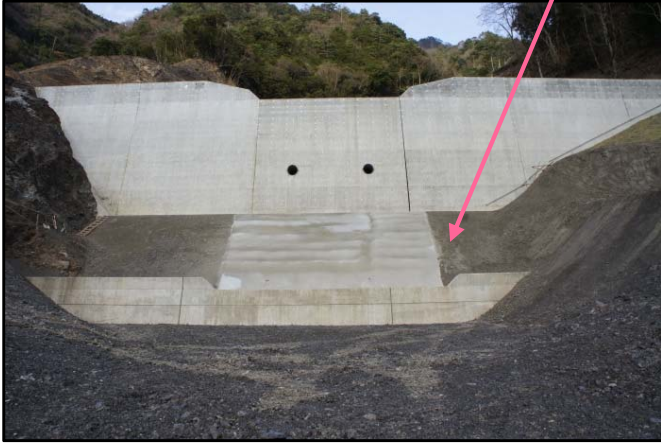
第1号谷止工 完成状況