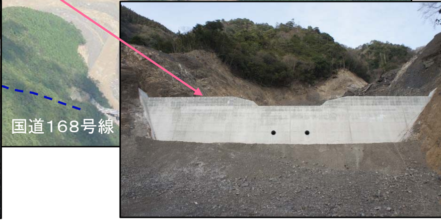
第2号谷止工 完成状況