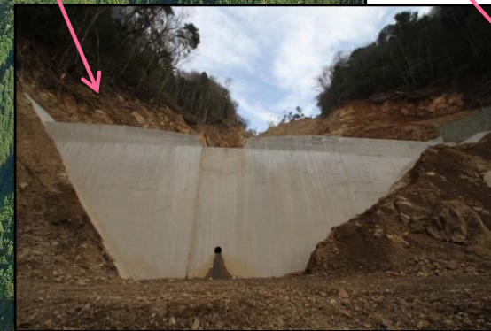
A谷第1号谷止工 完成状況