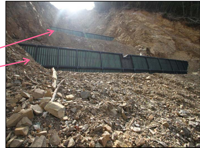
1号、2号鋼製砕土留工 完成状況