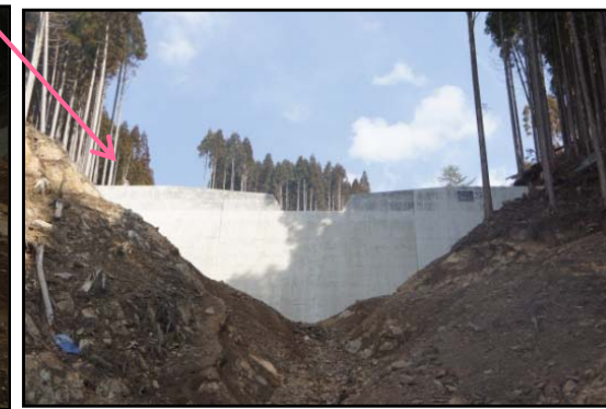
B谷第1号谷止工 完成状況