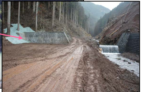
第2号床固工 完成状況