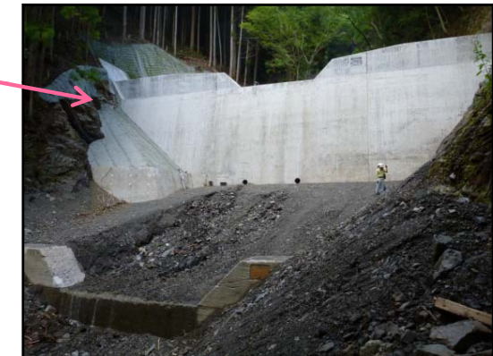
第1号谷止工 完成状況